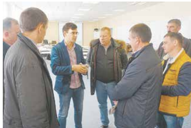
Повышать квалификацию водителей и специалистов по сервису автотехники КАМАЗ результативнее в таких образовательных центрах

По итогам визита руководители ООО «Таргин Логистика» выразили заинтересованность в дальнейшем сотрудничестве по вопросам обучения своих специалистов по сервису автотехники КАМАЗ и повышения производительности труда на сервисных участках.