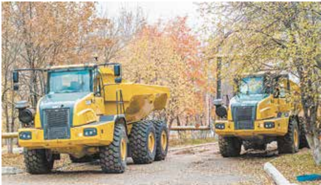
В России шарнирно-сочленённые самосвалы компании BELL уже много лет успешно работают на горнодобывающих предприятиях, в том числе и на подземной добыче. Их качество и надёжность опробовали московские и питерские дорожные строители, кемеровские и краснодарские горняки

свал BELL доступнее для российского потребителя. В соответствии с потребностью рынка «НЕФАЗ» готов повысить процент локализации сборки с постепенным увеличением от мелкосерийного выпуска до массового производства.