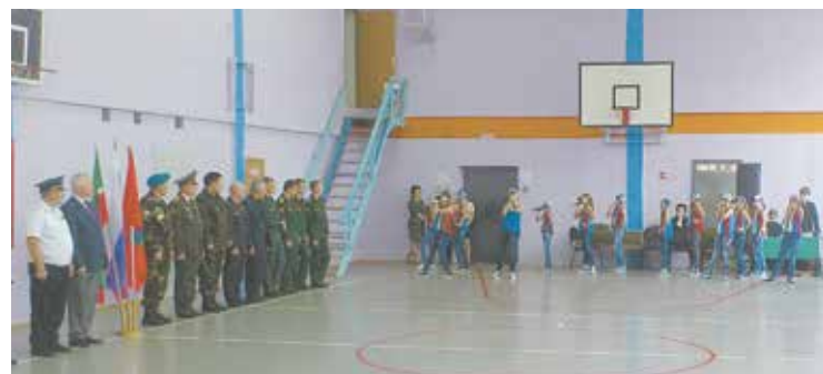
За ходом соревнований следят курсанты

люди оценивали выступления девяти команд школьников. В частности курсанты приняли участие в судействе таких этапов соревнований, как разборка-сборка автомата, стрельба из автомата с применением электронного тира, снаряжение магазина автомата. Победителем соревнований стала команда школы № 19, вторыми — команда школы № 55, на третьем месте — ребята из школы № 15.