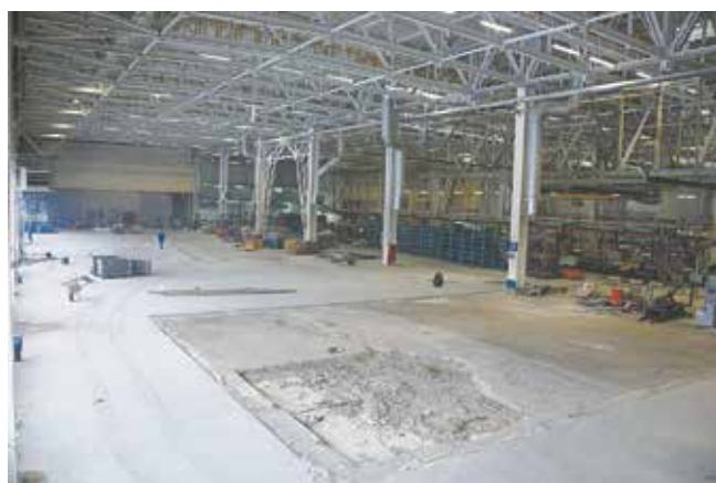
Под новое оборудование и сборочные линии освобождено 25 тыс. кв. метров площадей