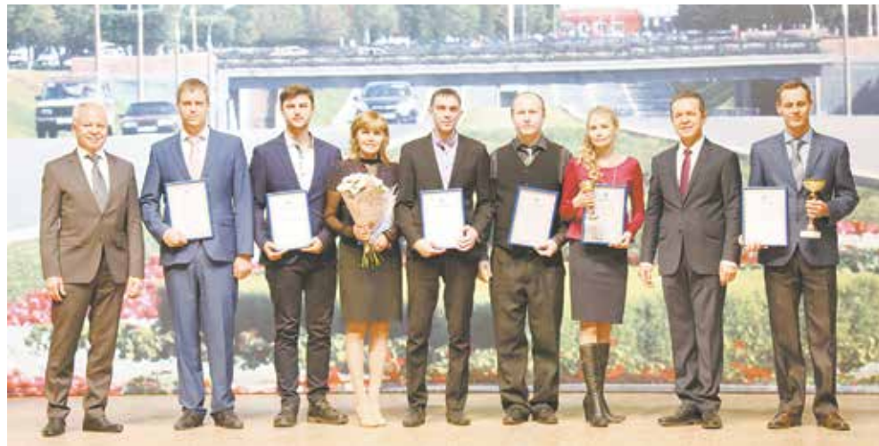
Собрали свои «лавры» и победители конкурсов профессионального мастерства, имена которых читателям «ВК» мы уже сообщили