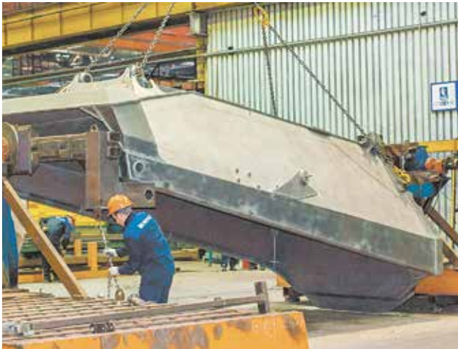
Установка кузова на кантователь