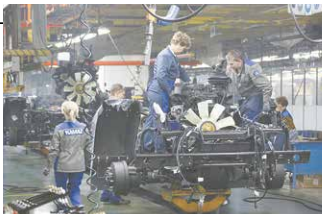
Управляющий комитет в рамках проекта создан для того, чтобы сделать работу ГСК более ритмичной

Часть проблем руководители и эксперты решили делегировать предприятиям-поставщикам. Разрешение ситуаций с несвоевременной доставкой придётся на себя взять логистическому центру. Необходимо срочно спроектировать и изготовить множество приспособлений,