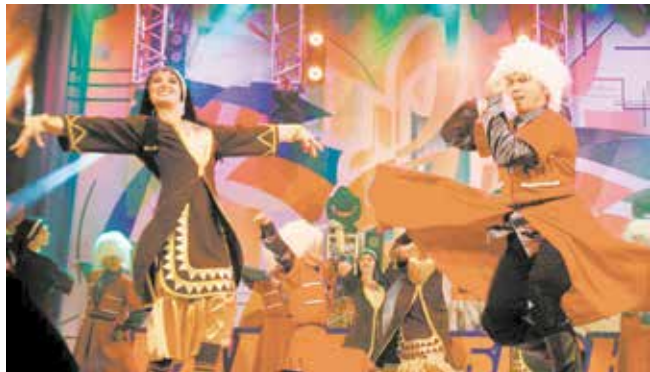
«Мтиулури» — танец яркий, зажигательный