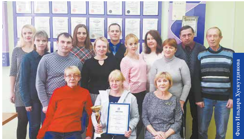
Конструкторский отдел инструмента и оснастки кузнечного завода — лучший технологический отдел ПАО «КАМАЗ»

По сей день мерило профессиональных достижений отдела — реализованные проекты в производстве.