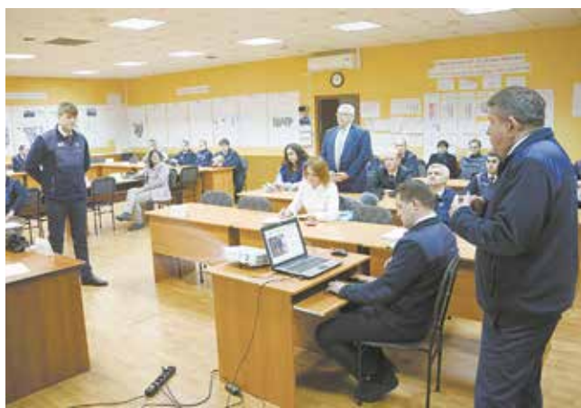
Во время мозгового штурма на заседании подгруппы предлагают варианты решения проблем, обозначенных бригадами

чтобы облегчить труд слесарей механосборочных работ. Всем ясно, что нужно работать быстро и аккуратно.