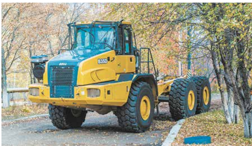
Первый самосвал BELL 40D «Сделано в России» прошёл испытания на одном из объектов ОАО «Учалинский ГОК», по итогам которых принято решение о запуске мелкосерийного производства в Нефтекамске

Напомним, в 2015 году, на первом этапе реализации проекта, была организована сборка, сварка и монтаж кузова первого опытного образца под контролем инженеров-сварщиков завода BELL на производственной площадке ПАО «НЕФАЗ». Этому предшествовал визит специалистов