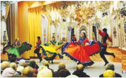
Яркие номера художественной самодеятельности в дворцовых интерьерах пришлись гостям по вкусу

После завершения концертной программы пенсионеров пригласили в зал заводской столовой, где для них были накрыты столы для чаепития.