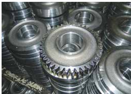
Прежде, чем стать шестернёй, заготовка проходит девять этапов механической обработки

Сами рабочие, будто услышав слова своего руководителя, сказали на прощание: «Напишите, что мы ждём в нашу бригаду новых людей: нам нужны хорошие наладчики с желанием работать».