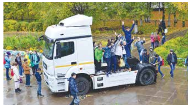
5490 — живое «наглядное пособие»