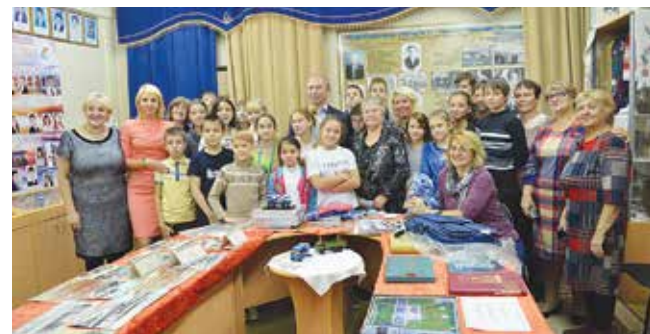
Как не сфотографироваться с легендарным Владимиром Чагиным?

Все участники получили призы от «КАМАЗа», но и организаторы заслужили ответную, причём сладкую порцию благодарности от подшефных. 4 «Б» преподнёс своим заводским друзьям чудесный пирог, испечённый собственными (плюс родительскими) руками. Надпись на нём «Вперёд, КАМАЗ!» стала и благодарностью, и напутствием.