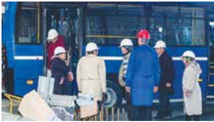
Гости искренне радовались увиденному количеству техники на территории завода

Заводской традиции поздравлять с круглыми датами работников, ушедших на пенсию с предприятия, уже более десяти лет. С течением времени меняется лишь