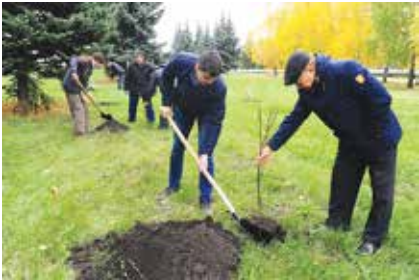
Через пару лет этот уголок наверняка станет одним из живописнейших мест на территории АвЗ