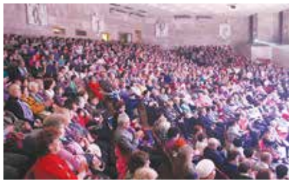
Заслуженная артистка РТ Гульдания Хайруллина, как всегда, была артистична, зал тепло принимал её особую манеру исполнения

Завершающими мероприятиями в рамках Декады пожилого человека стали праздничные концер-