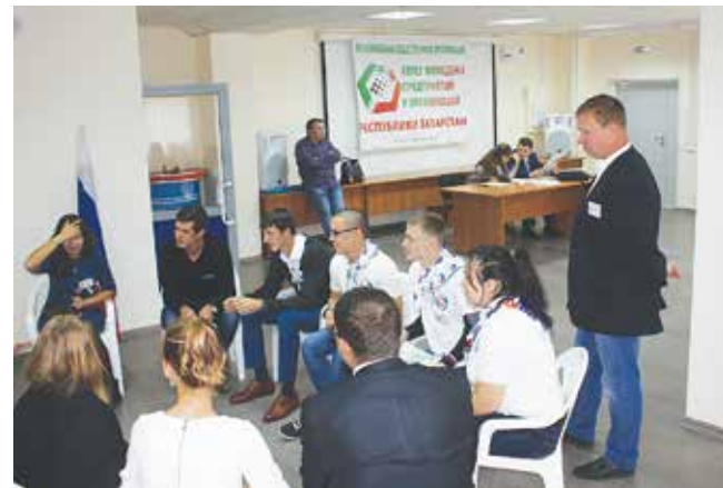
Подобные тренинги очень помогут молодым специалистам в работе

В конференции приняли участие сотрудники 16 предприятий республики. Среди них ПАО «Казанский вертолётный завод», ПАО «Казаньоргсинтез», Бугульминские электрические сети, ОАО «Казанский завод синтетического каучука» и другие.