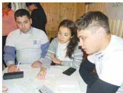
Мозг в напряжении: вспомнить все достоинства и недостатки своей работы оказалось непросто

А начальник отдела методологии оценки персонала и работы