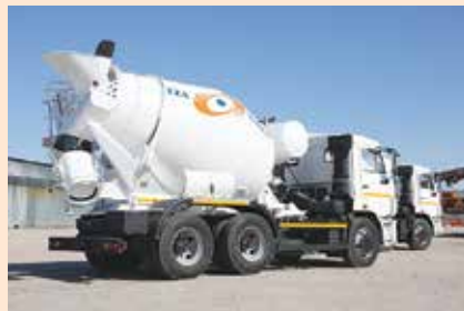
Модельный ряд получил новую фирменную покраску TZA/KAMAZ и рестайлинговое шасси белого цвета, на котором установлен мощный двигатель Cummins экологического класса «Евро-4» с пониженным уровнем шума и выбросами CO 2

Обе модели имеют планетарный редуктор РМВ6 итальянского производства, отечественный маслоохладитель, водяной бак ёмкостью 600 литров, комбинированные крылья-брызговики из алюминия и пластика. Кроме того, автобетоносмесители оснащены поворотным разгрузочным лотком с откидным жёлобом, механическим управлением, позволяющим точно контролировать вращение смесительного барабана, а также грязезащитным фартуком смесительного барабана, который поможет сохранить его в максимально возможной чистоте.