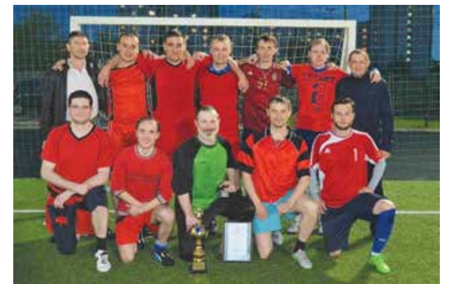
Титул победителя команда кузнечного завода завоевывает второй год подряд

По итогам прошедших игр третье место заняла команда пресово-рамного завода, второе — блока заместителя генерального директора — директора по развитию. Победителем турнира по мини-футболу ПАО «КАМАЗ» и обладателем заслуженного кубка стала команда кузнечного завода.