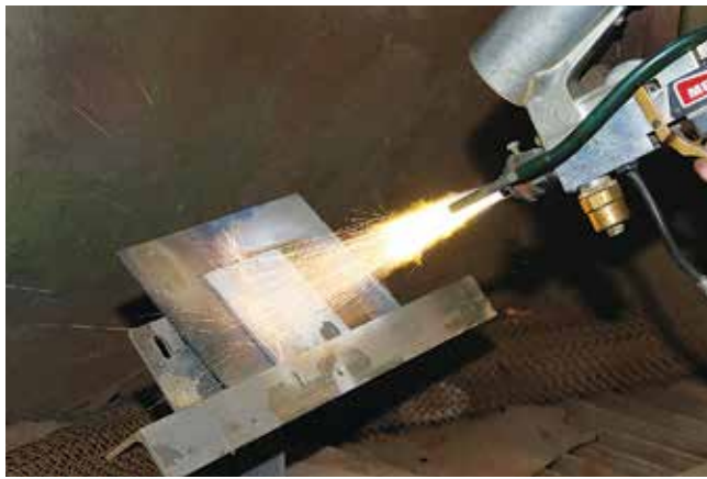
Напыление — красивый процесс