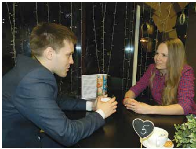
Работа на «КАМАЗе» уже объединяет

Speed dating, или быстрые свидания — это современный способ знакомств, который с невероятной ско-