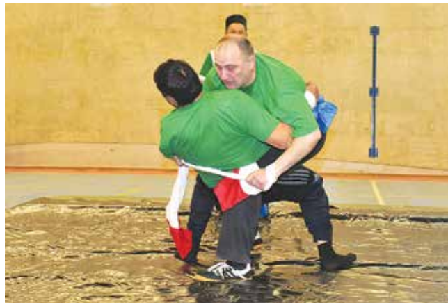
На борцовском ковре события развиваются стремительно. Важно не терять бдительность и верить в себя