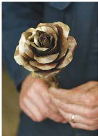
Латунные лепестки не вянут

Служба главного сварщика была создана, чтобы отрабатывать технологии сварки для всех заводов «КАМАЗа».