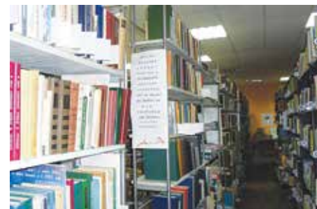
Каждая книга на своём месте

— То, что сейчас можно читать прямо с телефона — это, конечно, здорово, — завершает она нашу встречу. — Но когда держишь книгу в руках — чувствуешь: у неё другая энергетика. Думаю, и в бумажном варианте книгам ещё суждена долгая жизнь.