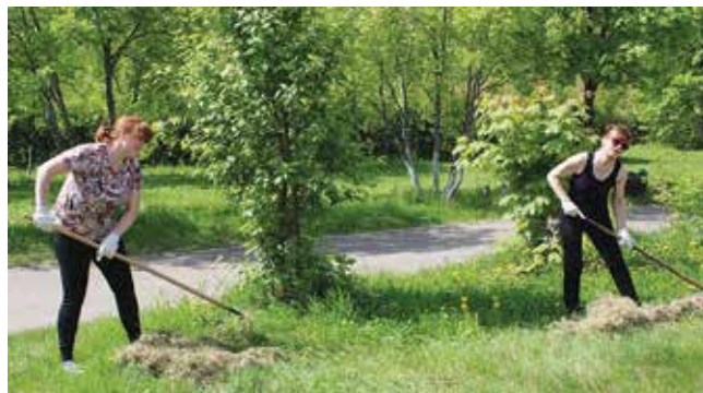
Ежегодно накануне открытия летнего сезона профком организует в ЛОК «Саулык» субботники. В этом году в них приняли участие около 400 человек. Камазовцы очищали территорию от мусора, красили бордюры и скамейки, наводили порядок в корпусах

Во время летних каникул профком также рекомендовал почаще организовывать в коллективах экскурсии выходного дня, праздники на базах отдыха, в которых могли бы принять участие и дети камазовцев.