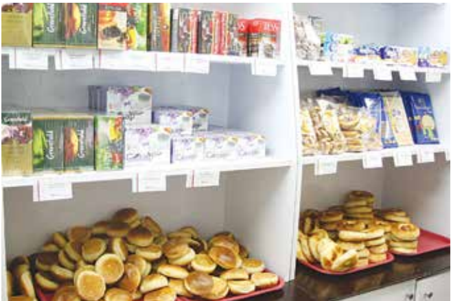
В новом буфете РИЗа разбирают всё

тобаром. Теперь с 11 до 13 часов над цехами появляется волшебный аромат сдобы — буфет продаёт свежую выпечку: пиццу, булочки, ватрушки, пирожные, треугольники, пирожки. У прилавка собирается приличная очередь, но буфетчица Наиля Невдобенко работает очень быстро: «Количество покупателей растёт каждый день, недавно было 200 человек, вчера 290, думаю, скоро будет больше 300».