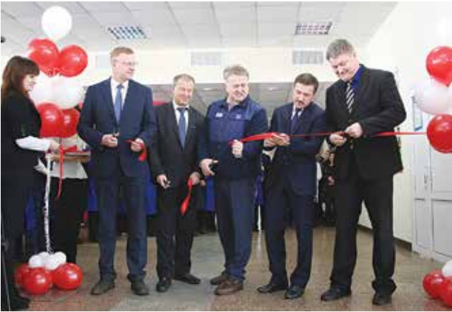
Столовая № 19 открыта!