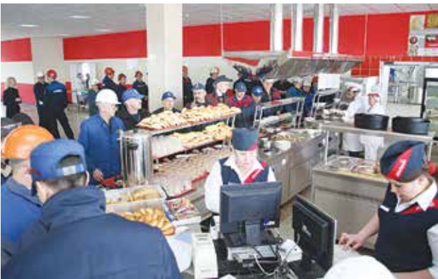
Теперь и места всем хватит, и пирожков

Сразу после разрезания символической красной ленты литейщики отправились