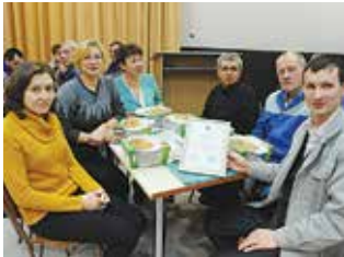
Вон чего надумали!

Победителями стали участники команды технологического отдела, второе место было присвоено команде отдела технического контроля автосборочного производства. Третье место досталось команде отдела анализа эф-