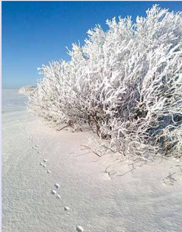
Лучший зимний день для Раисы Хакимовой

Призы будут вручены победителям на концерте, посвящённом 8 Марта, который состоится 3 марта в 11.15 в зале «Прогресс».