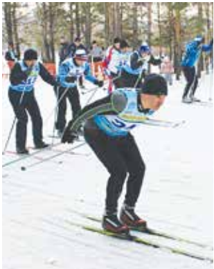
На победу нацелен каждый

Победителям личного первенства награды вручали