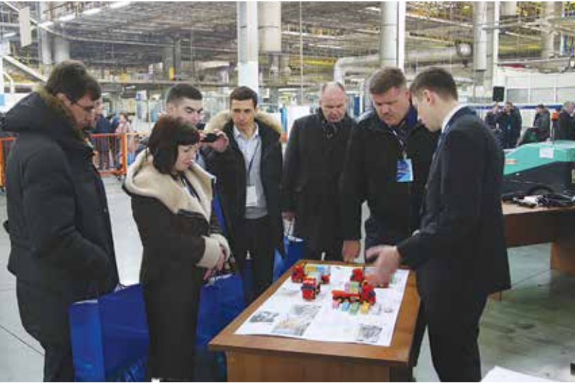
Место встречи — гемба