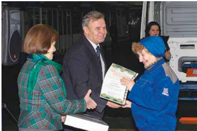
Награды в день рождения цеха получили 22 человека

— ЦССК влияет не только на работу завода, но и на весь «КАМАЗ». Мы всегда