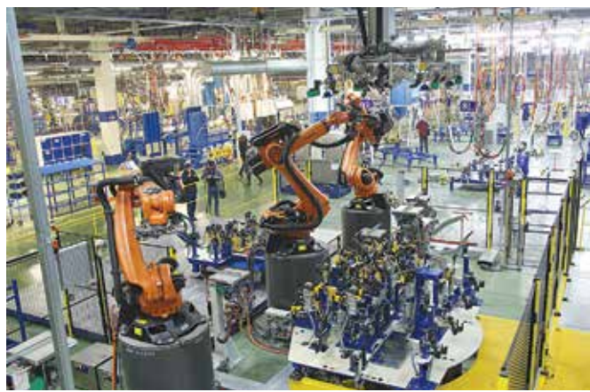
Сегодня цех может похвастаться самым современным оборудованием