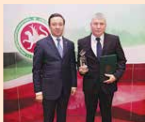
Церемония награждения Хрустальный кубок — награда за качество