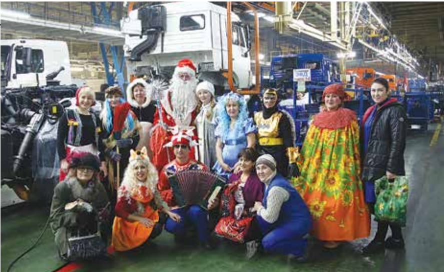
С такой весёлой компанией хочется сфотографироваться

Вот уже десять лет на автомобильном заводе живёт традиция: в преддверии Нового года по цехам ходят Дед Мороз со Снегурочкой, раздавая сладкие подарки. На этой неделе сказочный персонаж побывал на главном сборочном конвейере «КАМАЗа», в цехе сборки автомобилей.