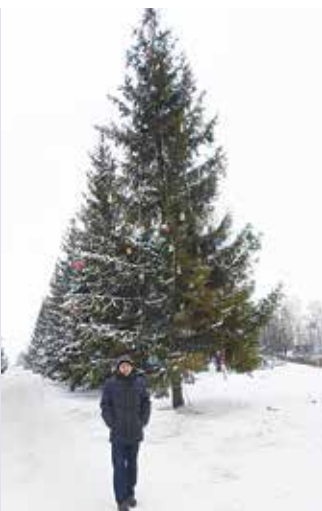
Ёлка-красавица у проходной

Как готовятся к Новому году на других заводах и в подразделениях «КАМАЗа» — на стр. 4.