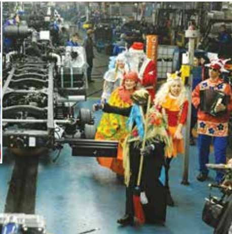
Герои сказок порадовали всех работников конвейера

Каждому бригадиру Дед Мороз и Снегурочка вручили по солидному пакету со сладостями для коллектива