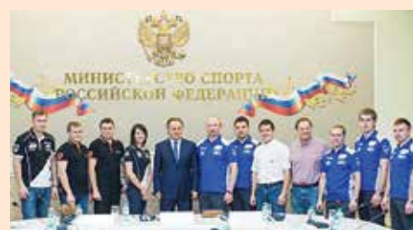
«КАМАЗ-мастер» к гонке готов

Министр спорта РФ Виталий Мутко встретился с командой «КАМАЗ-мастер» и пожелал гонщикам успешного выступления на очередном ралли-марафоне «Дакар-2016».