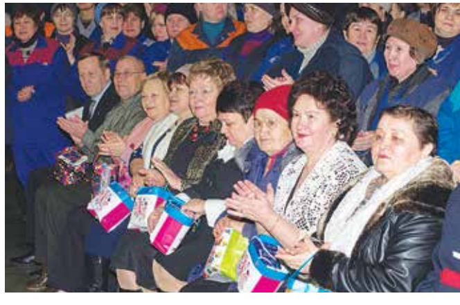
На праздник пригласили тех, кто 40 лет назад начал работу в новом цехе и выпускал первую кабину