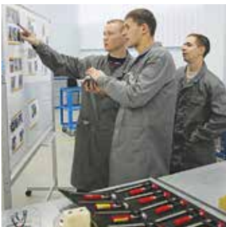
Сборка турбокомпрессора начинается с единственной подсказки — фото этапов создания узла

Начинается сражение пробной сборки. На стенде лишь несколько фотографий: снобоходимыми этапами этого процесса. Самые активные хватаются за эту соломинку и для начала пытаются просто собрать узел.