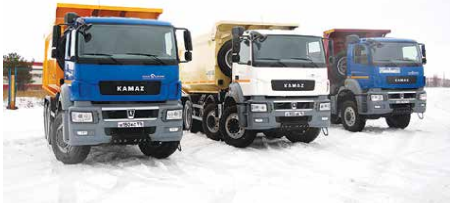
Новый модельный ряд снимают активнее, чем модный показ