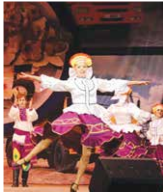
Танец «Барыня» у артистов «Премиума» получился озорным, задорным