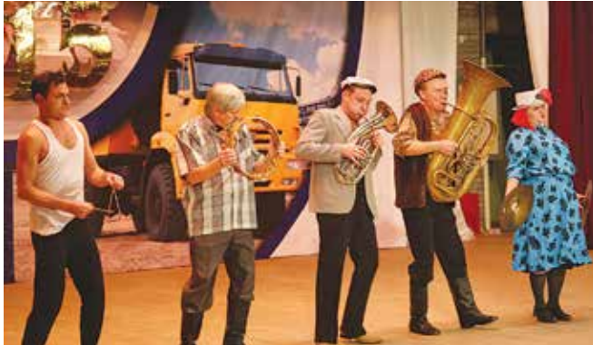
Еврейский оркестр готов играть при любых обстоятельствах, была бы плата за выступление