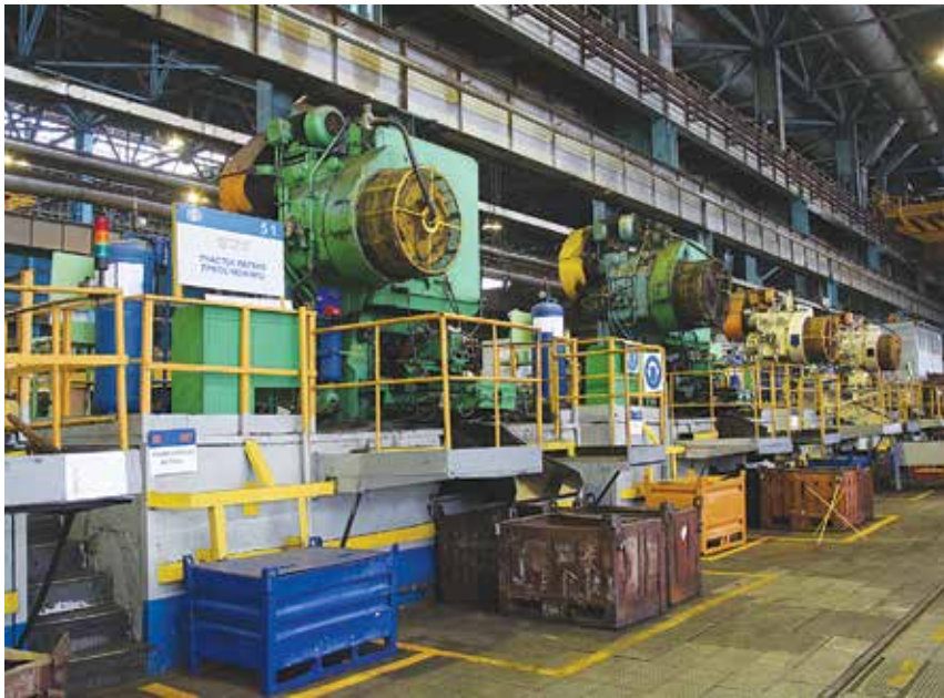
Помимо известной, «своей», забрали часть номенклатуры с горячей резки, законсервировав три единицы оборудования и тем самым добившись энергоэкономии.