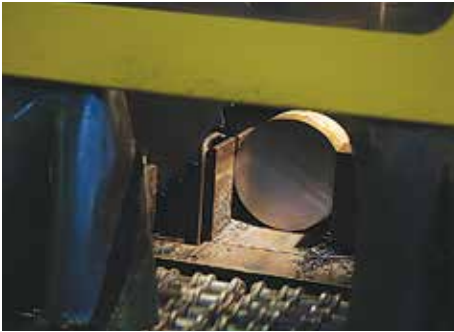
Оборудование выдаёт заготовку с точными геометрическими параметрами