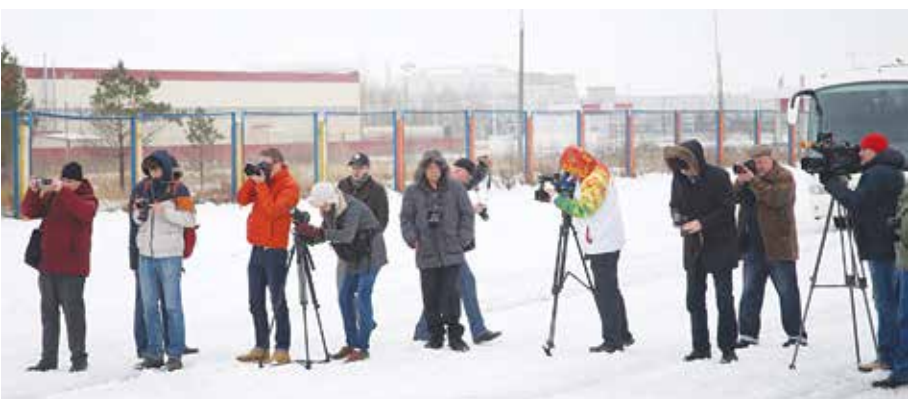
Самая интересная часть пресс-тура — тест-драйв автомобилей из новой линейки грузовиков

На кузнечном заводе, как, наверное, нигде, понимаешь: всё имеет свой вес. Может быть, потому, что здесь и производительность труда измеряется в специальных единицах — соотношении килограмм на час. В 2010 году этот показатель составлял 668, сейчас — 824. Важно, что ресурсы для её повышения заводчане видят сами.