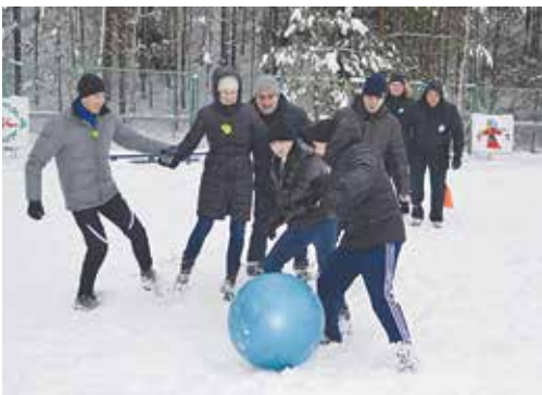
Отдыхать прессоворамщиками тоже мастера!

Мастера настроились на лёгкий отдых на свежем воздухе. Они ещё не знали, насколько большая и сложная программа их ждёт. Сначала всех поделили на шесть команд — началась зимняя спартакиада: гонки на ледянках, бег на одной лыже, бег в мешке, перетягивание каната и футбол макси-мячом. Бег на лыжах втроем давался не всем, зато показал невероятный командный дух: когда отстающая сборная поняла, что не сможет дойти до конца, к ним на подмогу рванула вся команда и буквально на руках, вместе с лыжами, донесла до финиша. После сумасшедшего многоборья спортсменам потребовался отдых: в этом помог небольшой