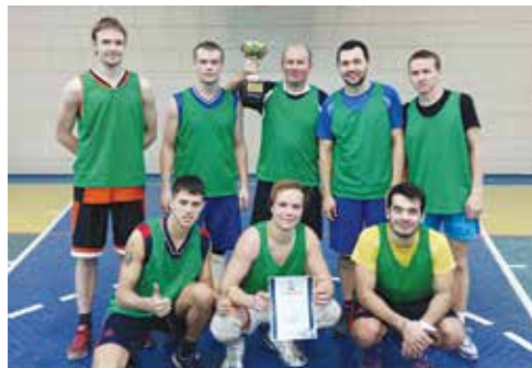
Команда завода двигателей — победители первенства по баскетболу ПАО «КАМАЗ»

«движков», не дав забросить сопернику ни одного мяча, со счётом 10:0. Во второй четверти команде БЗГД-ДР удалось улучшить ситуацию, но закончилась она всё же со счётом 15:14 в пользу дизелистов. В третьей четверти завод двигателей вновь ушёл в отрыв, создав определённое преимущество. В четвёртой четверти БЗГД-ДР не смогли изменить ситуацию, и завод двигателей одержал уверенную победу.