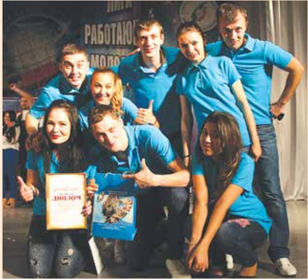
Команда «Полный привод»

Все команды, получившие возможность выступить на фестивале благодаря поддержке профсоюзной организации работников ПАО «КАМАЗ», прошли в четвёртьфинал. Следующее заседание Клуба весёлых и находчивых Лиги работающей молодёжи РТ состоится в январе.