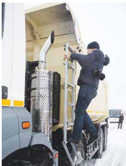
Современный КАМАЗ смог удивить бывалых автомобильных критиков

— Новый КАМАЗ нельзя даже сравнить с предыдущим, это совсем другой автомобиль, другое поколение. Плюсы новой машины — управляемость, устойчивость, плавность хода, тяговитый двигатель, который прощает ошибки при выборе передач. Хорошо настроенная ходовая часть и совсем другой уровень комфорта. Заметил небольшие огрехи в сборке: сход-развал в одной машине меня смутил, машина немного рыскала по дороге, но это не дефект конструкции — грузовик предсерийный, просто нужно отработать