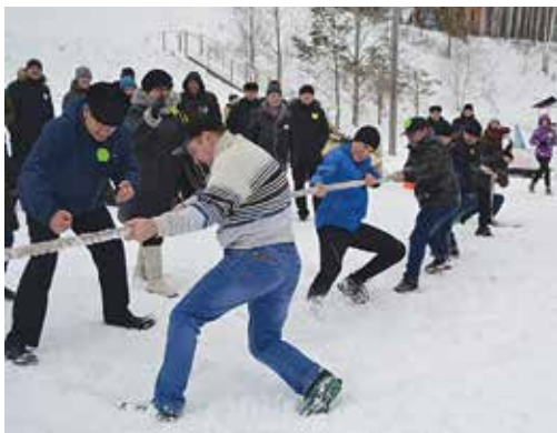
Фуршет и видеофильм о том, что сделано за этот