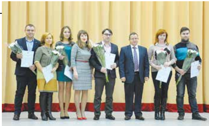
Выйти за грамотами и благодарностями смогли не все: работа не отпускает логистов даже в праздник