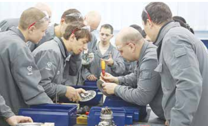
На этом этапе увлеклись все