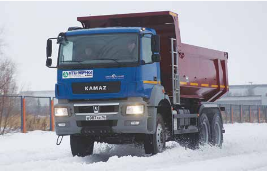
Несмотря на использование импортных агрегатов, стоимость новых КАМАЗов значительно ниже зарубежных аналогов

базой. Автомобили очень удобные: мне понравились комфорт и лёгкость управления. Водитель не должен утомиться и на десятую долю того, как он устанет на обычной машине.