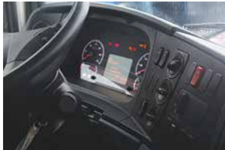
Новую приборную панель КАМАЗа просто не узнать. Компоновка и приборов, и органов управления получилась крайне удачной. Всё, что надо, — прямо под рукой, — считают эксперты