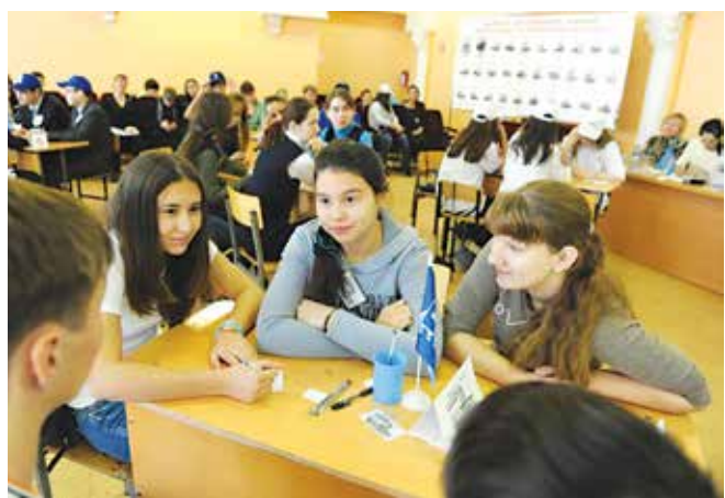
В глазах школьников — искренний интерес

Шефы даже на игру пришли не с пустыми руками: показали ребятам документальные фильмы о «КАМАЗе», принесли и установили стенды, где были представлены самые востребованные модели грузовиков и массовые камазовские профессии. А ещё подарили музыкальную паузу — новой композицией