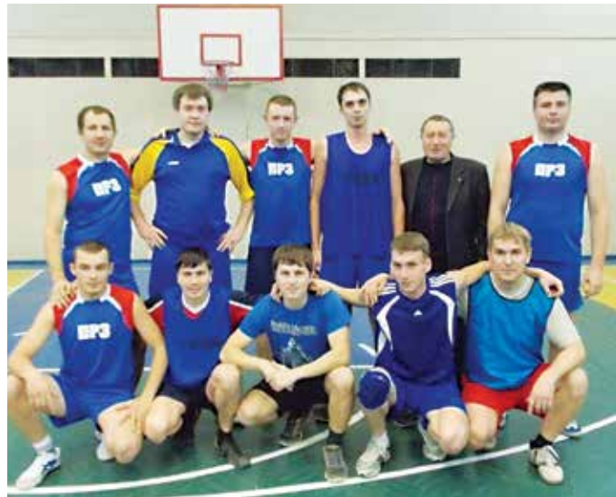
Вот она, сборная ПРЗ по баскетболу, завоевавшая титул чемпиона «КАМАЗа»

У научных работников свои подходы к оценке этого уникального явления. Всесоюзные комсомольские ударные стройки отличались особой системой организации труда и высокими темпами работы. Грандиозное строительство обеспечивалось идеологическими подготовленными кампаниями, значительными финансовыми вливаниями и жёсткими мерами по мобилизации трудовых ресурсов. Всё это позволило в короткие сроки не только возвести крупные промышленные объекты, но и построить целые города.