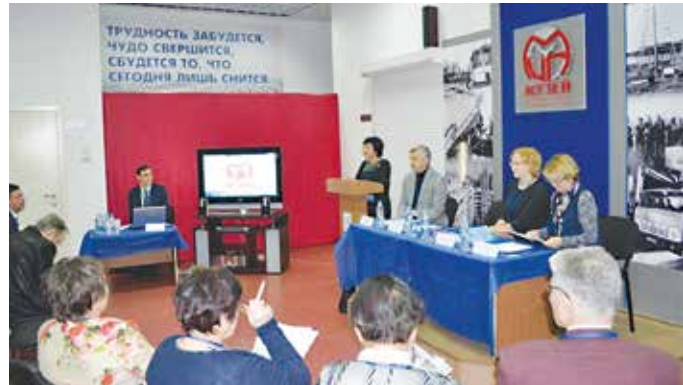
Возведение автогиганта даст учёным ещё немало пищи для размышления

Итоги этой конференции пока не подведены, но уже впро обсуждать другие, более насущные проблемы, связанные с экономическими вызовами, которые приходится принимать нашему моногороду.