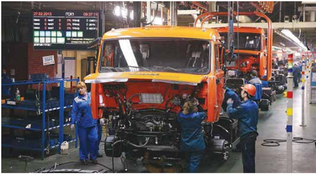
Цель «КАМАЗа» — выйти на уровень выпуска 1,15 автомобиля на одного человека

Преимущественное право на сохранение рабочего места будут иметь работники, обладающие наивысшей квалификацией, имеющие высокие результаты труда и личную вовлечённость в деятельность «КАМАЗа».