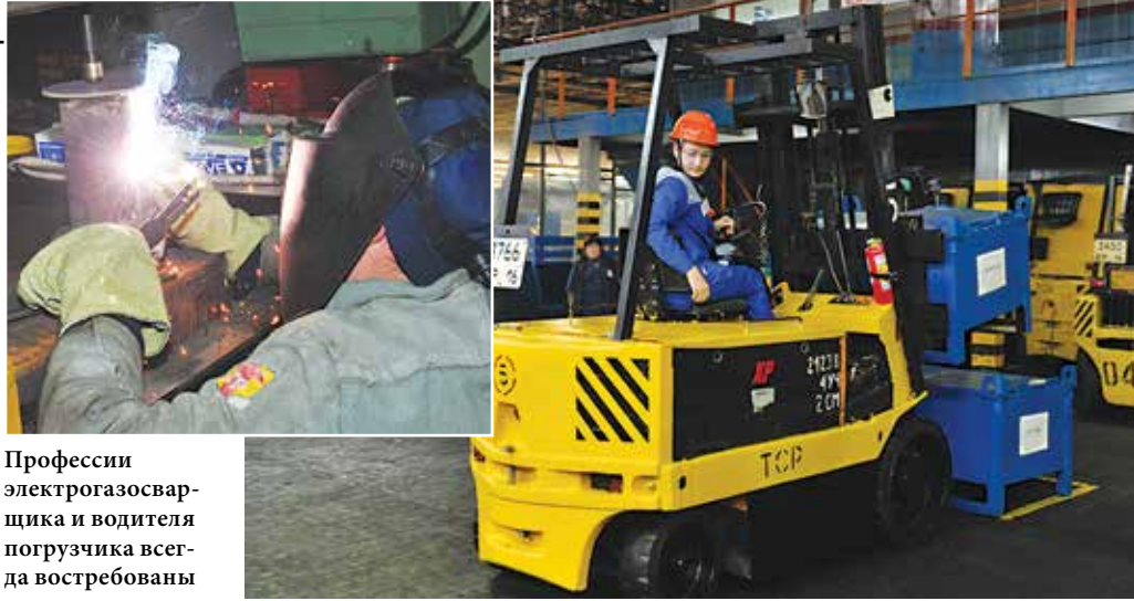
Профессии электрогазосварщика и водителя погрузчика всегда востребованы

В 2015 году будет продолжена работа по материальному стимулированию за повышение эффективности труда, при которой в подразделении сохраняется 50% фонда заработной платы высвобождаемых работников. Благодаря этому увеличится зарплата тех, на кого будут возложены дополнительные функции.