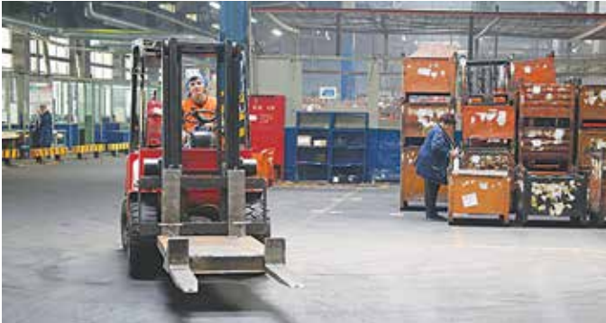
Здесь разместится участок сборки и испытаний коробки переменных передач

передач КАМАЗ, а будущее — за новой коробкой, поскольку реинжиниринг предусматривает создание перспективного семейства автомобилей. С серийного производства