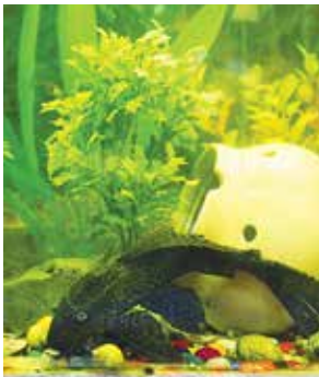
Эти усачи на заводе чувствуют себя отлично

четыре гурами, меченосцы, моллинезии. Условия рыбкам созданы по высшему разряду: воду регулярно меняют, есть фильтр, аквариум выглядит эффектно за счёт декоративного замка и амфоры, водорослей и цветных камушков. Деньги на содержание бригадных питомцев люди сдают сами, а также используют профсоюзный фонд.