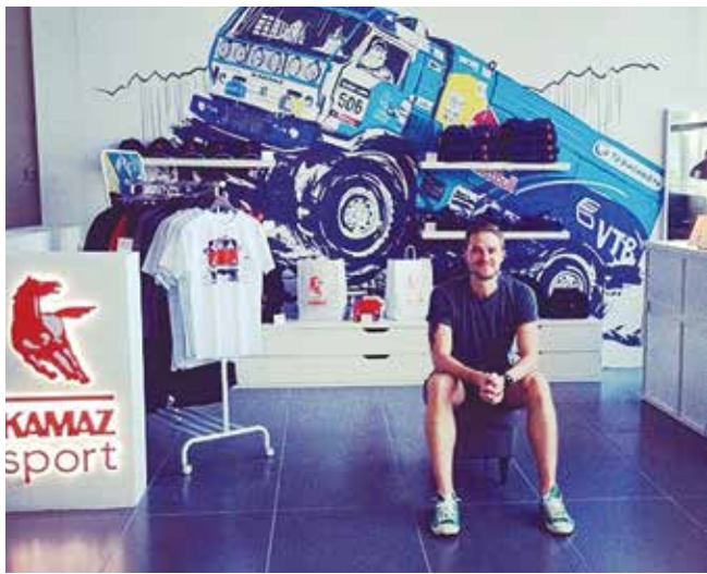
Новый магазин бренда в обновлённом аэропорту

Хит продаж молодого бренда — кепки и футболки. KAMAZ sport выпускает одежду коллекциями, на подходе — осенняя: свитшоты, штаны, расширенный ряд футболок. В ближайшее время в «камазовское» можно будет одеваться круглый год: поступят в продажу жилетки и тёплые куртки. А вот интернет-магазин бренда временно не рекламируется, так как спрос на вещи превышает предложение и владельцы не могут гарантировать бесперебойную доставку.