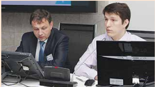
Камазовцы уже освоили методы трёхмерного проектирования, теперь передают опыт коллегам

Закончилась встреча знакомством с резидентами ИТ-парка. Новые идеи всегда нужны для подпитки любого проекта.