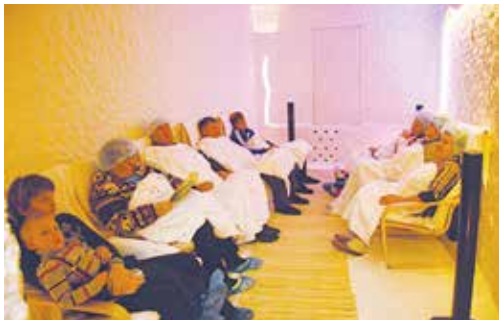
▲ Современные методы лечения приятны и эффективны