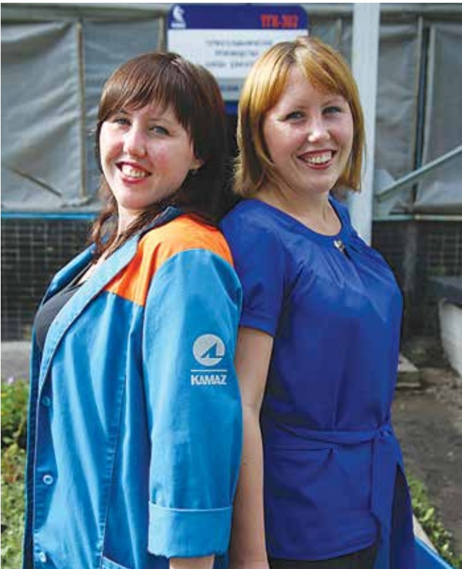
Друг друга сёстры часто называют по-домашнему — Лёлик и Анюта

«Если честно, в жизни не думала, что на «КАМАЗе» окажусь. Считала: сложное производство, одни взрослые люди, старички. Но в городе поработала на одной-второй-третьей работе. И всё не-