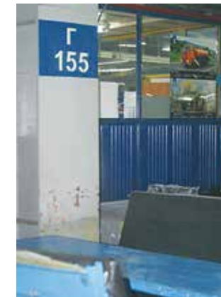
Отметка Г-155, упоминаемая в письме

Оказалось, бригада, страдающая от табачного дыма,