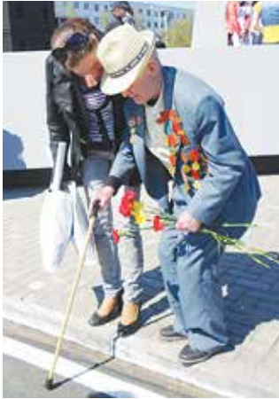
Есть на кого опереться