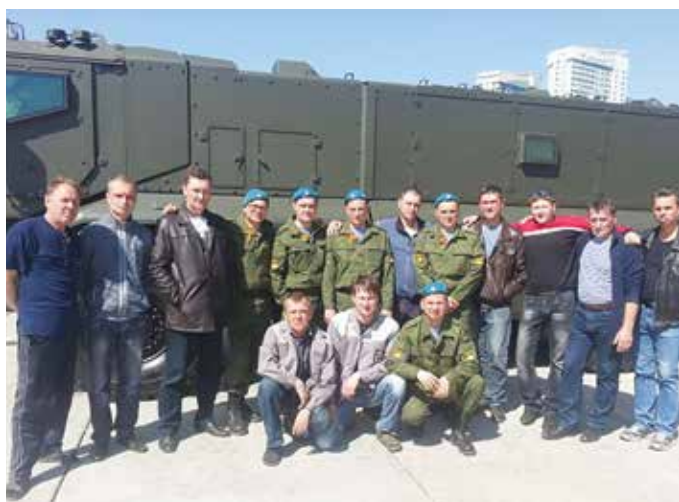
«Парадная» команда «КАМАЗа» в этом году была в несколько раз больше, чем обычно: военные новинки требовали особого внимания

Военная автотехника «КАМАЗа» приняла участие в параде Победы в Москве. Впервые по брусчатке Красной площади прошла механизированная колонна автомобилей «Тайфун-К». Сопровождали новейшую технику специалисты ОАО «КАМАЗ».