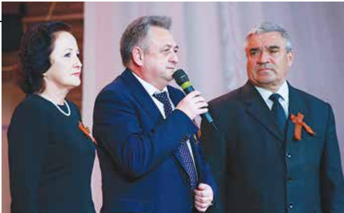
Слова благодарности ветеранам