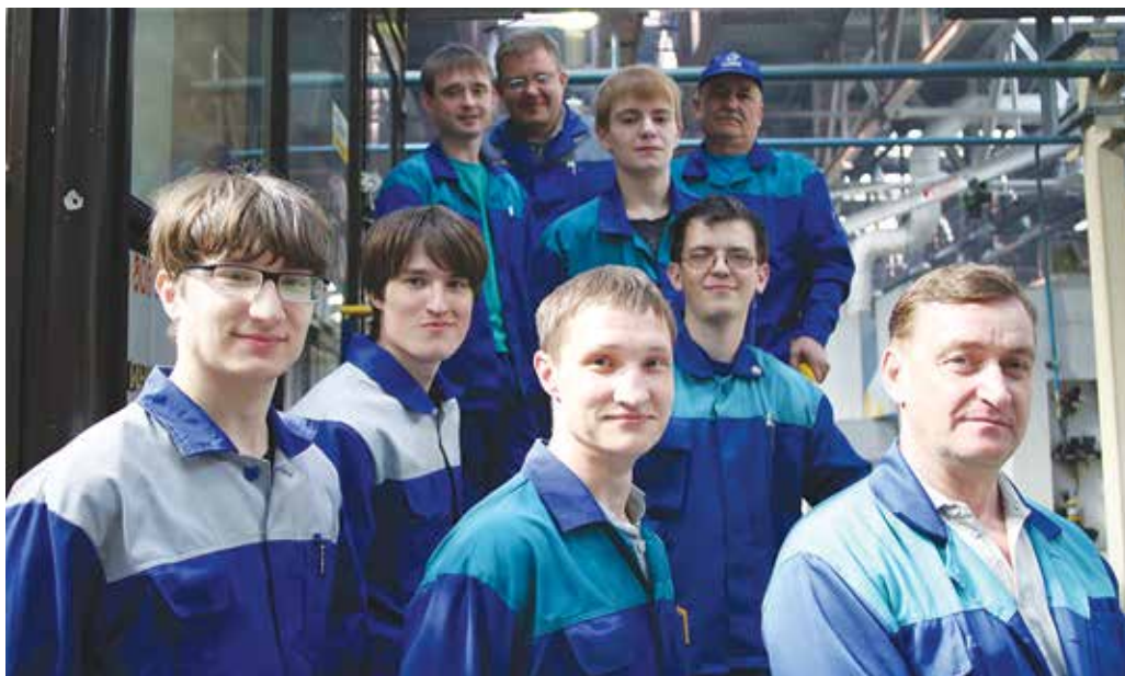
411-я бригада линии «КАММИНЗ коленвал» завода двигателей

Линия работы и жизни Без дружбы и взаимопонимания работать на линии