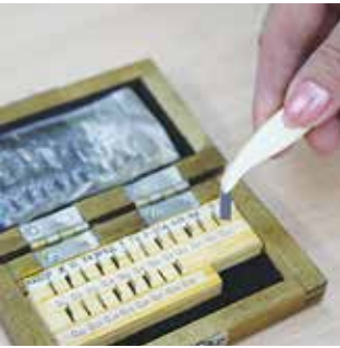
Меры длины концевые — эталоны. Они применяются для выполнения высокоточных измерений. Самые маленькие на профессиональном жаргоне называют блошками. Их берут специальным пинцетом, чтобы пластины не нагревались от тепла руки