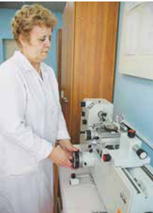
Поверка линейно-угловых средств измерений проходит в специальных помещениях с соблюдением температурного режима