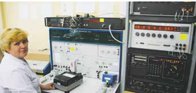
Установка для поверки особо точных средств измерений в лаборатории поверки контрольно-измерительных приборов

метрологической службы ОАО «КАМАЗ». Документ важен для заказчиков, которые должны удостовериться, что все измерения, проводимые на предприятии, соответствуют установленным требованиям».