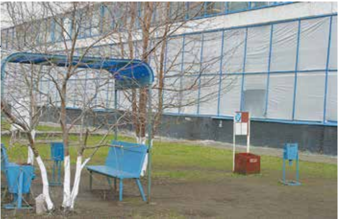
Место для курения на воздухе

Победители получат почётные грамоты и кубки, а для «Профессионала НТИЦ» и «Перспективы НТИЦ» предусмотрено ещё и повышение индивидуальных надбавок.