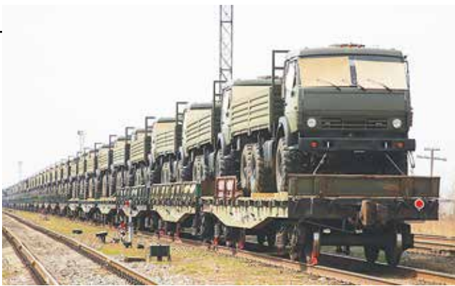
Теперь автомобили доставляются заказчику крупными партиями, быстро и под надёжной охраной

Наверное, мы все в какой-то степени «дети войны». Иначе откуда это ощущение, что ты тоже — «связной»?..