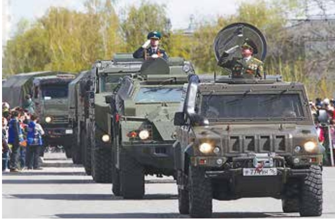
Колонна камазовских «танков»