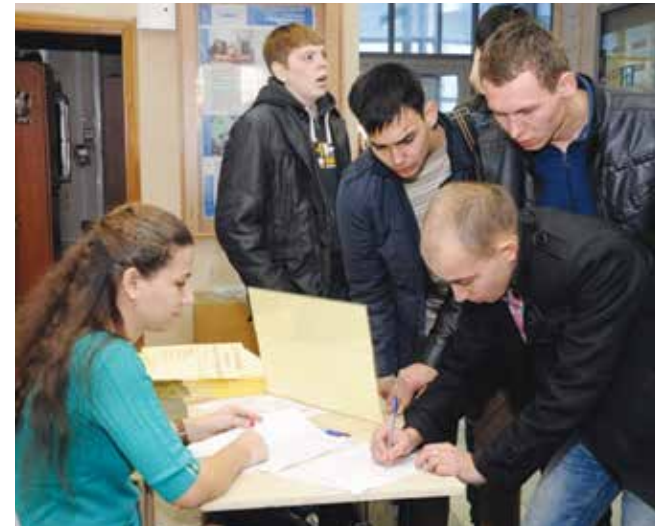
Желающих поступить в технические вузы достаточно

ство на «КАМАЗе» согласно полученному образованию, они должны отработать здесь не менее трёх лет. Влиться в камазовскую систему будет несложно: до договорённости с вузами целевики проходят практику на предприятии, пишут курсовые работы и диплом по камазовской теме.