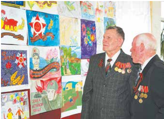
В ДК «КАМАЗа», где проходил вечер, посвящённый Дню Победы, вернисаж собрал множество поклонников