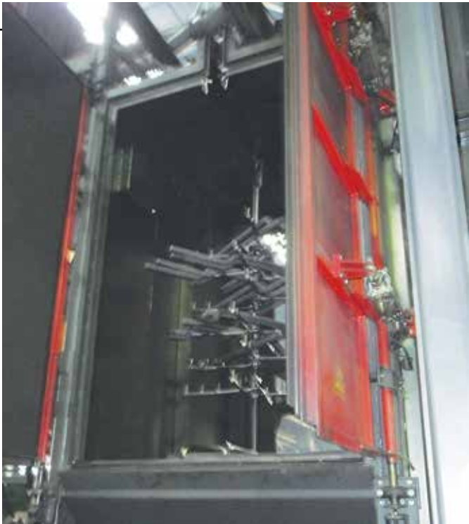
Если линия работает — ремонтников рядом не увидишь. Но их как любит автоматика человеческую заботу