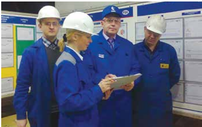
20 баллов за каждый критерий — и победа близка!

Кстати о победителях. Для них предусмотрено поощрение. Первые итоги будут подведены в апреле. В дальнейшем на «литейке» планируется сделать конкурс по качеству традиционным.