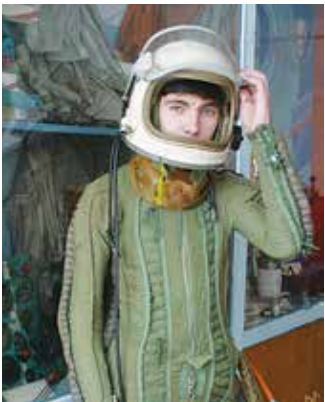
Примерить стратосферный высотный костюм лётчика и представить себя в роли космонавта могли ученики школы № 3