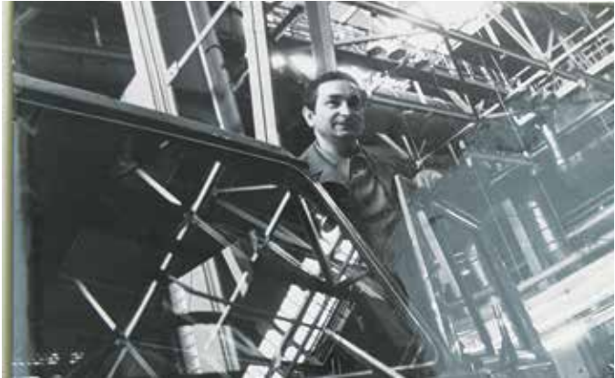
Дважды герой Советского Союза Валерий Быковский побывал на «КАМАЗе» вместе с женой и сыном в 1977 году