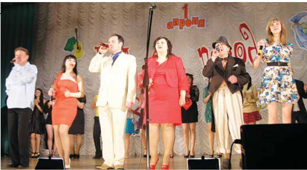
«А припев — все вместе, всем залом!»

« — Вы сегодня пили? — Ну вот всегда один и тот же вопрос. И ведь никто не спросит: «Вы сегодня ели?» Если шутки-юмор со сценами звучали самых разных