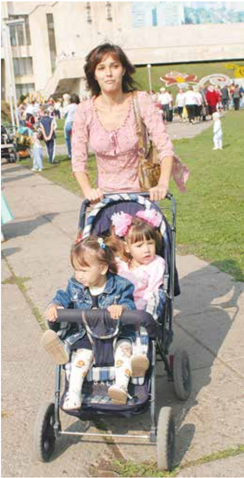
Вопрос выделения путёвок в детсады — один из самых важных для камазовцев

Чаще всего камазовцы стучатся в двери от- дела социально-экономической работы и охраны труда, в 2013 году к его специалистам обратились за консультацией 161 камазовец. Через эту общественную организацию ра-