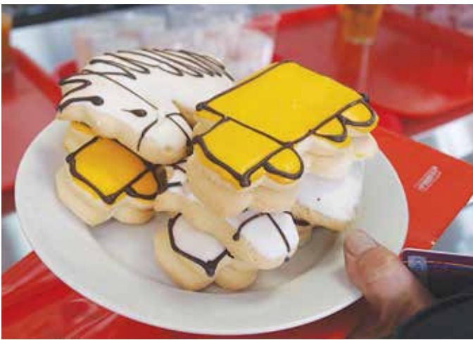
Пирожные в виде машин и лошадок уходят на ура

между собой они обсужда- ли, насколько приятней ста- ло в помещении. По словам регионального менеджера «Содексо» Руслана Хакимова, изменения коснулись внеш- ней стороны столовой. На средства «Содексо» (почти 1,8 млн рублей) закуплены линия раздачи и посудомоечное обо- рудование. Прежняя линия раздачи плохо поддерживала температурный режим. На деньги «КАМАЗа» обновлён интерьер. Производственные помещения пока не ремон- тировались, это намечено на вторую половину года.