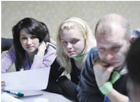
Идёт мозговой штурм

Все материалы, нарабо- танные на этом молодёж- ном форуме, — ценнейшая информация для развития молодёжного движения. Благодарим всех участников за высокую вовлечённость и интересные идеи! Теперь мы уверены, что проведём Всероссийский студенче- ский профориентационный форум на достойном уровне.