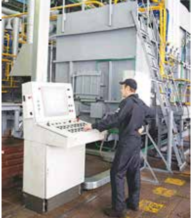
Человеческий фактор сведён к минимуму благодаря автоматике

Касаткин, — чтобы меньше человеческого фактора участвовал. За атмосферой в печи, температурой наблюдает автоматика. Информация о каждой неполадке выводится на главный экран компьютера. Термист занимается загрузкой и выгрузкой, следит за параметрами работы агрегата на всех участках. Здесь большую часть работы за него делает компьютер, все регулировки, в основном, производит автоматика. При любой неисправности загорается