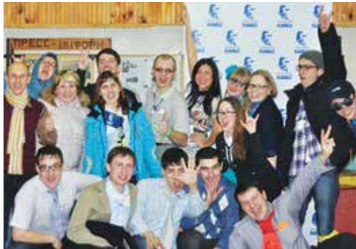
Для молодёжи на «КАМАЗе» есть дела