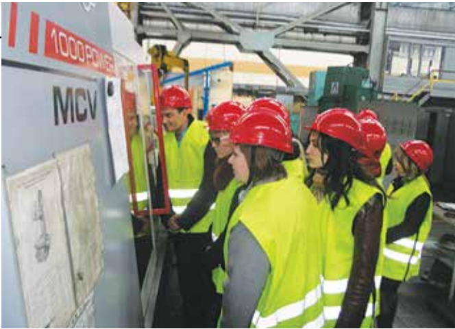
Побывав только в штампово-инструментальном корпусе, мож-но узнать о буднях кузнечного завода в целом

С начала марта в организациях и подразделениях ОАО «КАМАЗ» зарегистрирован один несчастный случай. При ремонте оборудования на кузнечном заводе в шкафу управления печи произошло короткое замыкание. Вольтова дуга обожгла кисти электромонтёра и правую ногу. Причины несчастного случая расследуются.