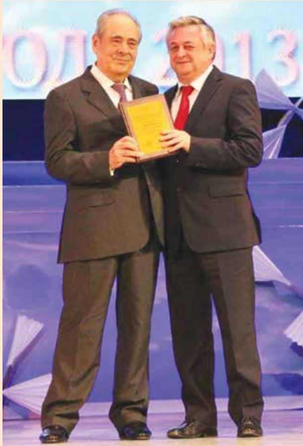
Минтимер Шаймиев поблагодарил ОАО «КАМАЗ» за добрые дела

Открыл церемонию награждения предприятий, организаций и благотворительных фондов, которые на протяжении многих лет оказывают поддержку нуждающимся, государственный советник РТ, председатель Попечительского совета фонда «Возрождение» Минтимер Шаймиев. Он напомнил, что 2007 год был объявлен Годом благотворительности, потому что к тому времени уже по разным направлениям совершались благие дела, и нужно было на уровне государственной политики дать сигнал о них всему татарстанскому обществу. Сегодня благотворительность присутствует во многих сферах жизни республики, и лучшее подтверждение тому — имена победителей конкурса. Одно из них — «КАМАЗ», в 2013 году на благотворительные проекты компания направила почти 27 млн рублей. Автогигант стал лауреатом в номинации «Крупные и средние предприятия». Всего в этой номинации победу одержали 35 предприятий республики.