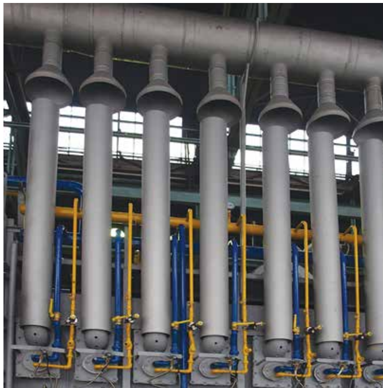
Агрегат предназначен для улучшения стали