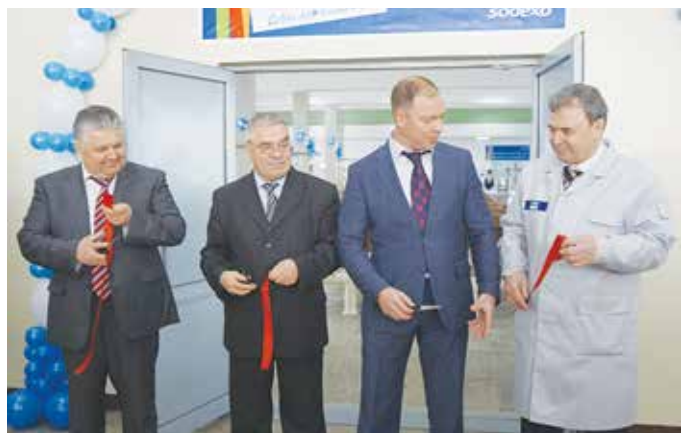
Обновлённая столовая распахнула двери