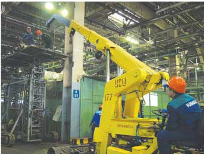
На демонтаже заняты пять человек: водители погрузчика и подъёмника, два газорезчика и ответственный за соблюдение мер безопасности

ководством завода было принято решение о демонтаже конвейеров. В настоящее время идёт внедрение Производственной системы «КАМАЗ», поэтому обратили внимание на освещённость, которая влияет на безопасность труда. Рабочий должен прийти на работу и уйти в нормальном состоянии, без травм. Каждое рабочее место мы должны сделать комфортным».