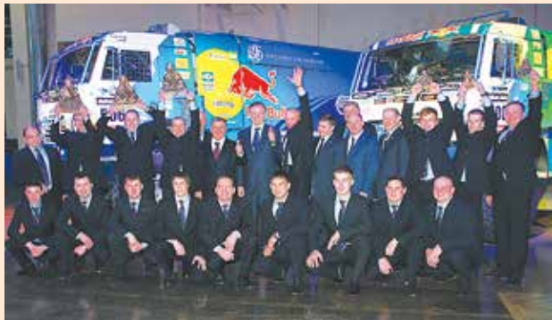
Команда — супер!

В Москве прошёл ежегодный бал чемпионов Российской автомобильной федерации. Сюда были приглашены чемпионы страны в восьми дисциплинах автомобильного спорта, коих по итогам прошлого сезона набралось 36 человек.