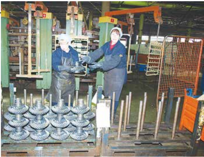
В цехе работает 86 человек по девяти профессиям. Здесь проводится цинкование, фосфатирование, хромирование и анодирование деталей силовых агрегатов и автомобилей. Гальванические покрытия применяются для защиты поверхностей деталей от коррозии