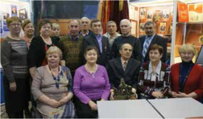
Ветераны ПРЗ с одним из главных камазовских «трофеев» — дакаровским бедуином

стали лидерами полуфинала. «Система сервис» и «Сборная сетевой компании» из Альметьевска, «Сделано по ГОСТу» из Казани показали несколько забавных стемов и реприз и вслед за лидерами прошли в финал нынешнего сезона. А вот челнинским командам «Мои красавцы» и «Фреш», представляющим ОАО «КАМАЗ», повезло меньше. Увы, хоть ребята и старались быть смешными и музыкальными, в финал не вышли. Правда, команда литейщиков «Мои красавцы» всё-таки поедет в апреле в Казань, где ей будет предоставлено право открыть в качестве почётных гостей пятиминутной «Визиткой» финальные игры КВН «Лиги работающей молодёжи РТ».