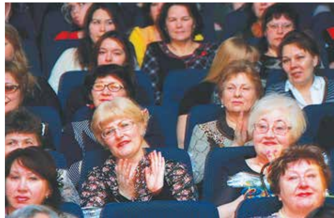
Гостям праздника приём пришёлся по вкусу