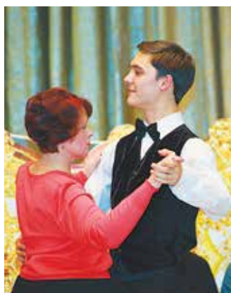
Тур вальса для наших императриц

дисменты non-stop, танцы поклонниц, хоровое исполнение любимых песен. Одно смутило — ребята в своих приветствиях обращались к жителям Нижнекамска. Бдительные императрицы, занявшие места в первом ряду, тут же указали на ошибку, чем непомерно смутили гостей. Быть может, стоит пригласить этих артистов ещё раз, чтобы они повторили уроки географии? Камазовским императрицам нужны только грамотные подданные!