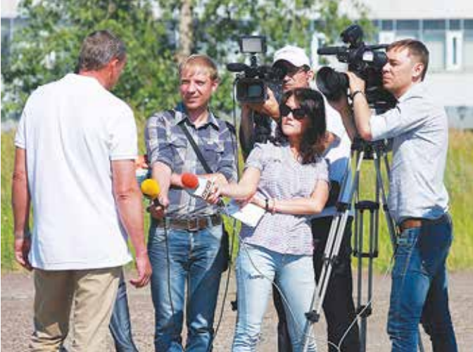
Работа корреспондента — это новые встречи, места, впечатления