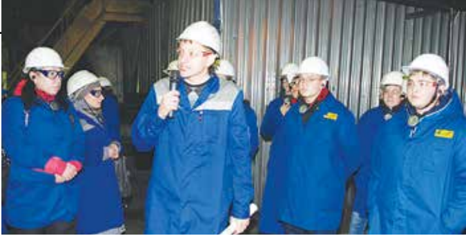
Студенты собственными глазами должны увидеть своё будущее место работы

Ответственными за нарушения, ставшие причинами несчастного случая, признаны исполняющий обязанности сменного мастера, начальник смены цеха ремонта оборудования — они не проконтролировали соблюдение требований охраны труда. Исполняющий обязанности начальника цеха не обеспечил требования охраны труда, а исполняющий обязанности главного механика «допустил выполнение нормативных актов, не учитывающих специфику оборудования литейного завода и не обеспечивающих безопасность проведения ремонтных работ». Сам пострадавший также нарушил требования охраны труда: вместо того, чтобы осмотреть заклинившую опору с площадки обслуживания, он, не имея допуска для работ на высоте, производил действия в условиях воздействия опасного произ-