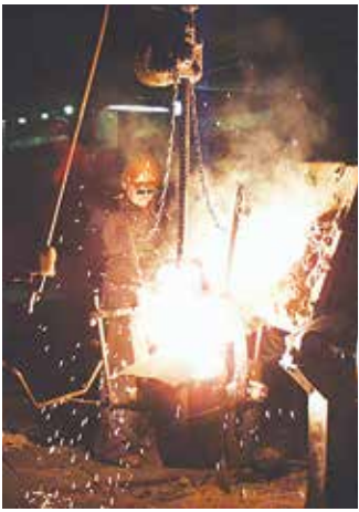
На литейном ждут тех, кого не пугает настоящая работа

Литейный завод предложил порядка 250 вакансий по большому перечню профессий. Заинтересовались предложением автогиганта, но пока не приняли решение более 70 человек, они получили брошюры о заводе с контактными телефонами. Ещё 20 златоустовцев сделали свой выбор в пользу «литейки» и получили направление на медкомиссию. Двое ребят, плавильщики 25 и 27 лет, сразу приехали в Челны и устроились в предоставленном заводом общежитии. В пятницу у них был первый день на производстве чугунного литья, маштабы завода их впечатлили.