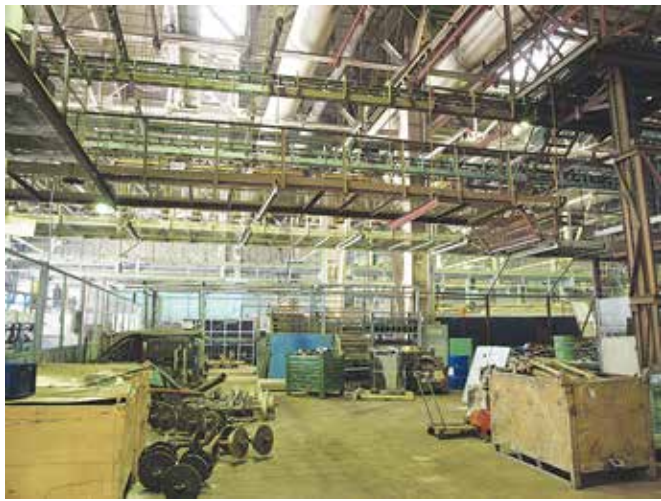
Тонны металла, находящиеся пока под потолком, увезут на литейный завод

Демонтаж не влияет на работу цеха, непредвиденных остановок нет. Рабочие довольны изменением освещённости и говорят, что стало намного лучше.