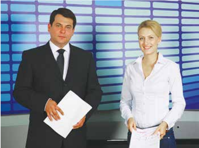
Программа «Вести КАМАЗа» востребована зрителем