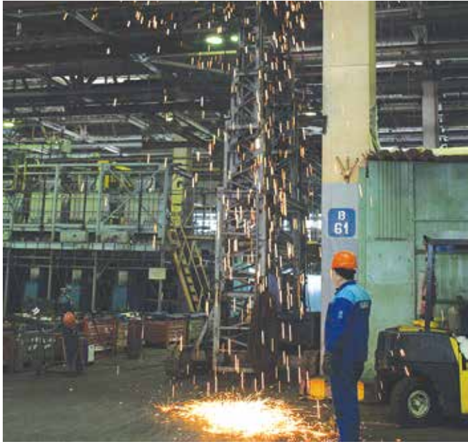
Газорезчики срезают транспортную линию и площадки обслуживания

нужную для погружения глубину. Наконец, требуемая точка найдена, пробиваем во льду майну — широкую прорубу. Дайверы погрузились на 52,3 метра, взяли пробы грунта и воды для учёных. Цель, к которой так трудно шли, взята. Наблюдатель от Всемирной конфедерации подводной деятельности (CMAS), логист команды знаменитого Жака-Ива Кусто Божана Остойич сделал специальное заявление и зафиксировала мировое достижение.