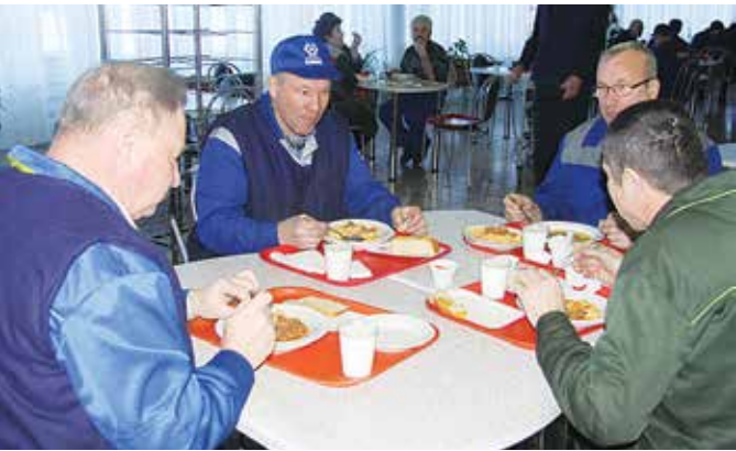
Какая работоспособность без сытного обеда?

На литейном заводе в двух столовых ведётся ремонт обеденных залов с установ-