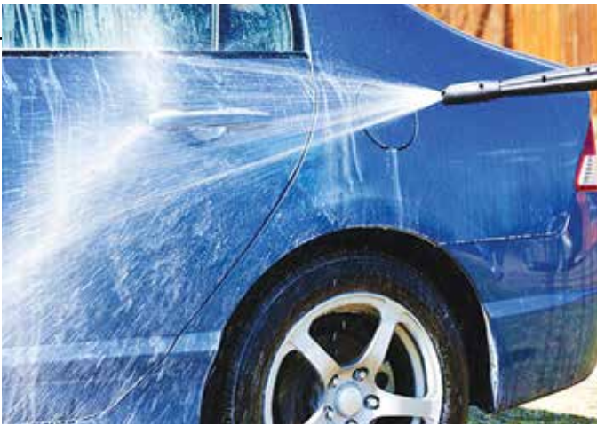
Машинам пострадавших вернут прежний вид

Мирное решение было выработано быстро. «Все пострадавшие получат услуги, которые помогут вернуть машинам внешний вид: мойку и чистку. Об этом мы сообщили всем пострадавшим. Их число к тому моменту выросло с 53 до 104: