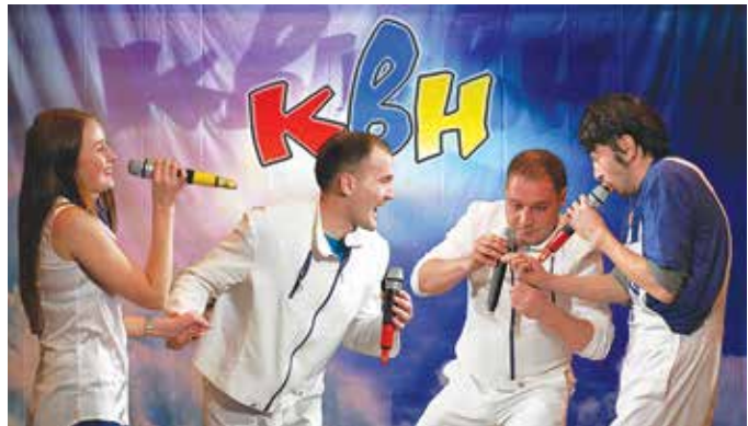
Победители зимнего фестиваля КВН, команда «Здви́г», придумали отличную приговорку «Мать моя наладчица!»

— Девушка, я хочу в такое место, где горячий песок, живописный пейзаж, чтобы телефон не ловил, а ещё получить несмываемый ровный загар!