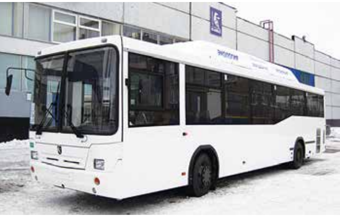
2013 год прошёл «под трендом автобуса» — в лизинг передано 268 НЕФАЗов

— Самую разную. Этот год, можно сказать, прошёл «под трендом автобуса», что в значительной мере связано с реализацией программы государственного субсидирования субъектов федерации, приобретающих экологически более чистую технику для пассажирских перевозок. Мы передали в лизинг 268 НЕФАЗов. Популярностью пользуется самосвальная техника. Кстати, и половина новых магистральных тягачей,