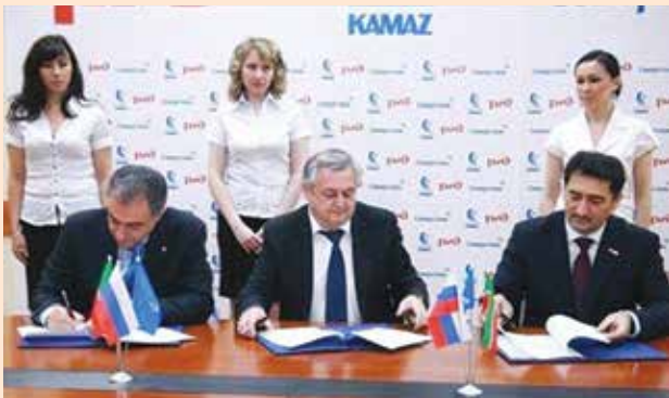
Апрель 2013 года. Подписание трёхстороннего соглашения о сотрудничестве до 2015 года между ОАО «РЖД», ОАО «Северсталь» и ОАО «КАМАЗ».

Говоря о будущем, компании договорились разработать и согласовать программу технического сотрудничества по освоению перспективных инновационных марок сталей, рассмотреть вопрос о создании консигнационных складов в Набережных Челнах и Нефтекамске на производственных площадках «КАМАЗа» и «НЕФАЗа», а также согласовать основные параметры поставки металлопроката в соответствии с принципами системы вытягивания «Канбан».