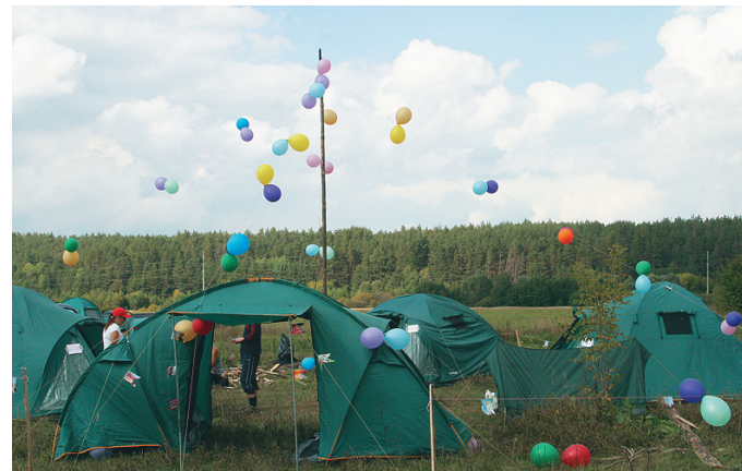
Завод двигателей, победитель конкурса бивуаков, взял спецэффектами

украсила стоянку шариками, превратив её в шашито. На конкурсе туристской моды камазовцы выставили одежду «на все сезоны»: от трусов из фольги до многослойного наряда «мама собрала на турслёт». «Паразиты» показали выездную церемонию бракосочетания, «Литая звезда» — туристический