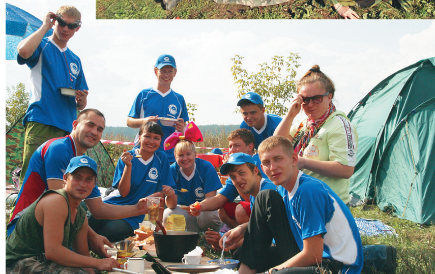
«ЧВК» видно издали