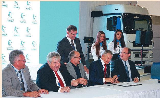
Момент подписания соглашения

Десять магистральных тягачей КАМАЗ-5490 намерено приобрести одно из крупнейших транспортных предприятий России ОАО «АВТОВАЗТРАНС». Второе предприятие, которое берёт в лизинг пять новых КАМАЗов модели 5490, — ООО «КамаЗАвтоМаркет», официальный дилер Камского автозавода в Челябинске.