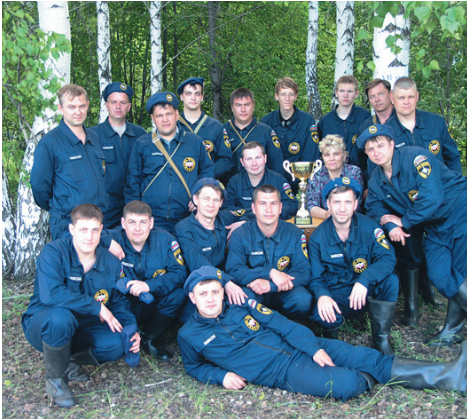
Команда кузнецов к соревнованиям готова

приходится тратить на ожидание. А если я купил талон на комплексный обед, я знаю, что в 11.20 допью чай и смогу распорядиться оставшимися 40 минутами по своему усмотрению. Блюда для комплекса каждый день разные, так что я и время экономлю, и пробую всё, что подают в нашей столовой.