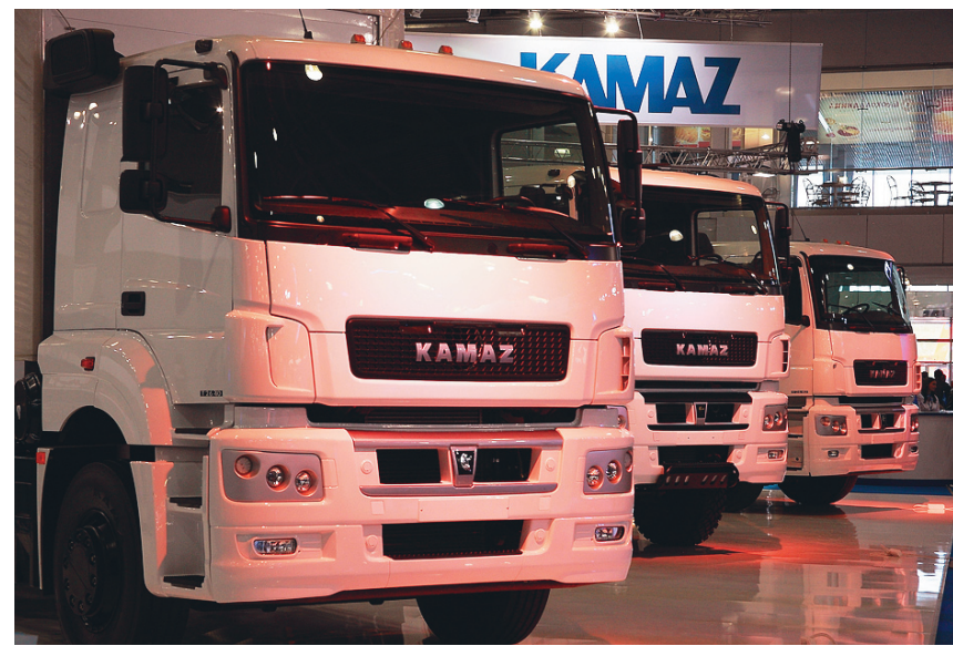
Модели КАМАЗ-65206, 65802 и 65207 вызвали большой интерес у посетителей

На площади более 70 тысяч квадратных метров выставочного комплекса «Крокус Экспо» свои достижения продемонстрировали свыше 400 компаний-производителей.