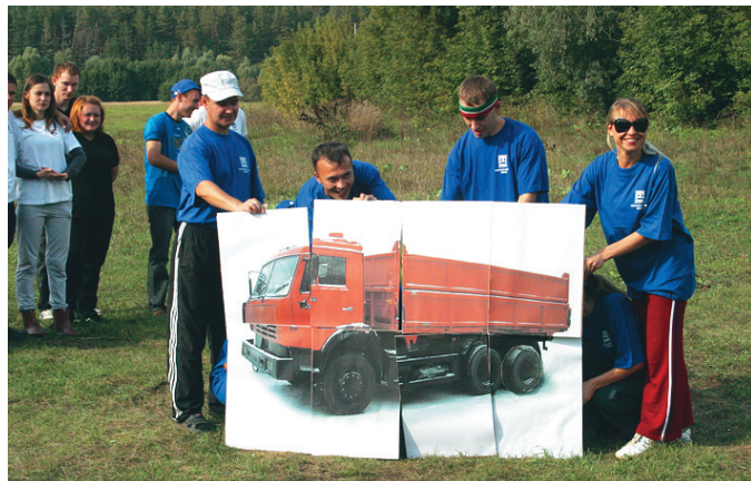
«Полный привод» с Ав3 показал «Сделай сам»: им досталось третье место