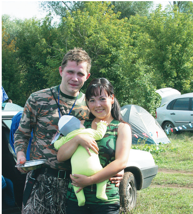
Победители турслёта-2013 — команда ПРЗ «Паразиты»