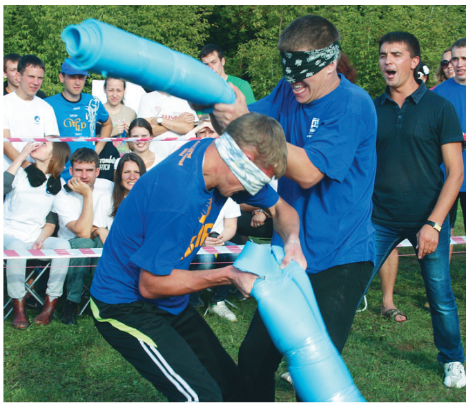
«Домбайский бокс» прибавлял и емного очков, но вызвал много интереса. Правила простые: с завязанными глазами нужно колотить соперника свернутым в рулон походным ковриком. Побеждает тот, кто чаще попадает по противнику