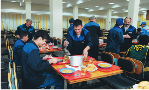
Заказали комплексный обед — проходите сразу к столу

— Чтобы получить комплексный обед, надо заранее приобрести специальный талон на день, два или на неделю вперёд. В этом документе указывается дата, стоимость и номер стола. Это делается для того, чтобы работники столовой знали, на какое количество обедов и по каким категориям комплексов им накрывать