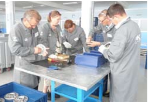
Участники тренинга предлагают свои пути решения проблем

На кофе-брейке обсуждение продолжилось — никто не упустил возможность поделиться своими идеями. И уже на следующем этапе тренинга под названием «Оптимизация» участники предложили свои решения проблем, отображая это ви-