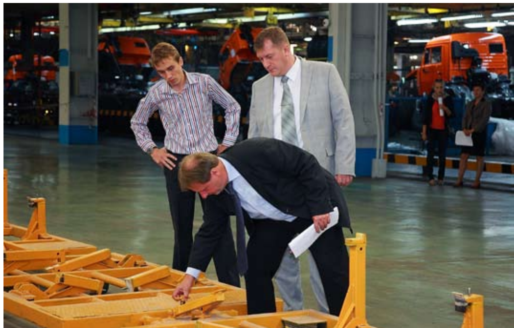
Площадки к началу производства кабины подготовлены

Совсем скоро начнёт своё движение конвейер по сборке новой кабины «КАМАЗа». Он расположился на месте ремонтных цехов и складов логистического центра. При подготовительных работах использованы самые современные технологии.