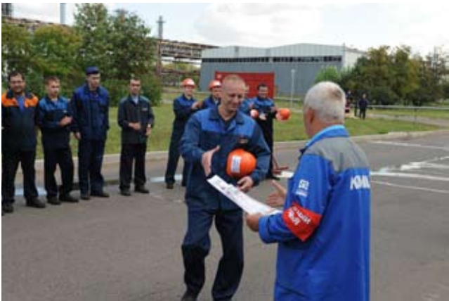
Эти люди не подведут

Выступление пожарных дружин — одно из самых зрелищных мероприятий: