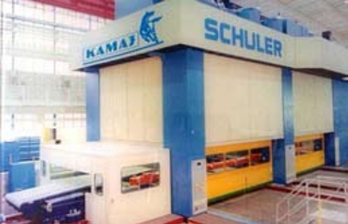
В числе выставленного на торги оборудования — многопозиционный пресс-автомат «Шулер»

— На сайте покупатель может оставить свою заявку. После истечения минимального срока в 30 дней при условии наличия других заявок информация о продаваемом объекте будет выложена на электронные торги. Регистрация на электронной торговой площадке достаточно проста и доступна. И здесь мы делаем расчёт на возможность охватить широкую аудиторию потенциальных клиентов, ведь в торгах смогут принять участие представители других городов и регионов. В результате желаемое получит тот, кто предложит большую сумму. Начальная же цена для оборудования рассчитывается как стоимость металлоло-