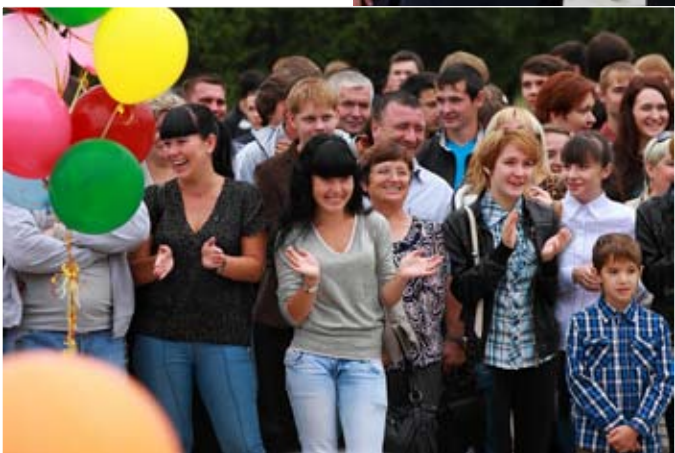
1 сентября — праздник всегда радостный

Также праздничные линейки состоялись в филиале