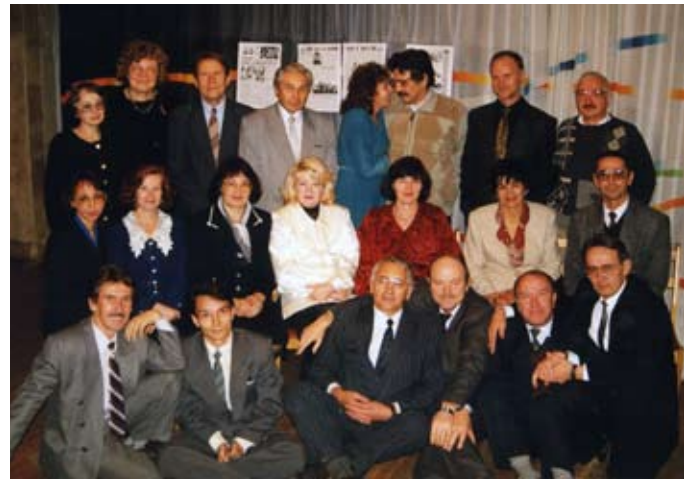
1998 год. Газете «Вести КАМАЗа» — четверть века

вход со стороны ул. Усманова. Дарителей ждут с понедельника по пятницу, с 8 до 17 часов (обед с 12 до 13). Специалисты готовы дожидаться тех, кто придёт позже. Тел. 52-78-64.