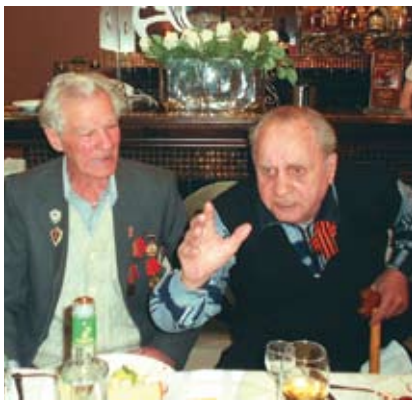
Им есть что вспомнить...

Накануне Дня Победы своих ветеранов чествовал прессово-рамный завод. В атмосфере душевного тепла и уюта, искреннего уважения и почитания проходила эта встреча.