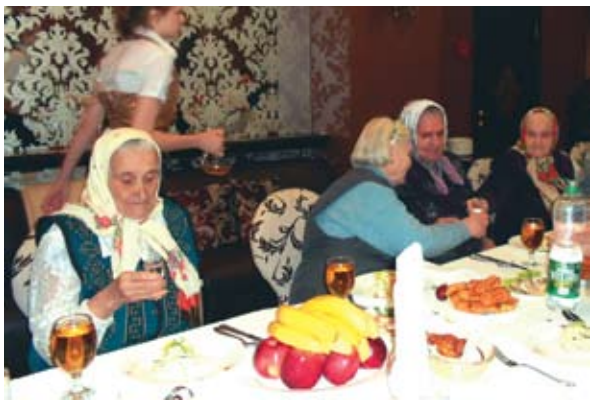
...и кого помянуть

Ещё задолго до праздника специалисты отдела кадров, курирующие пенсионеров и ветеранов завода, всем им позвонили, объяснили, где будет проходить встреча и откуда их будут забирать автобусы. Всем приготовили подарки, а работники Дома культуры завода и артисты художественной самодеятельности отренетировали концертные номера.