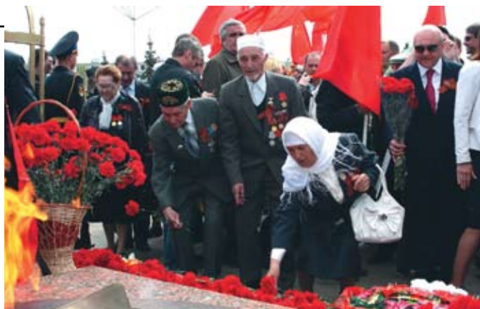
Пока есть силы, наши ветераны в этот день непременно стараются побывать на митинге.

Упал с двухметровой высоты слесарь-ремонтник цеха ремонта оборудования производства чугунного литья. 13 мая при ремонте турбины виброконвейера он случайно поскользнулся. У мужчины закрытый перелом трёх рёбер, ушиб мягких тканей, ссадины.