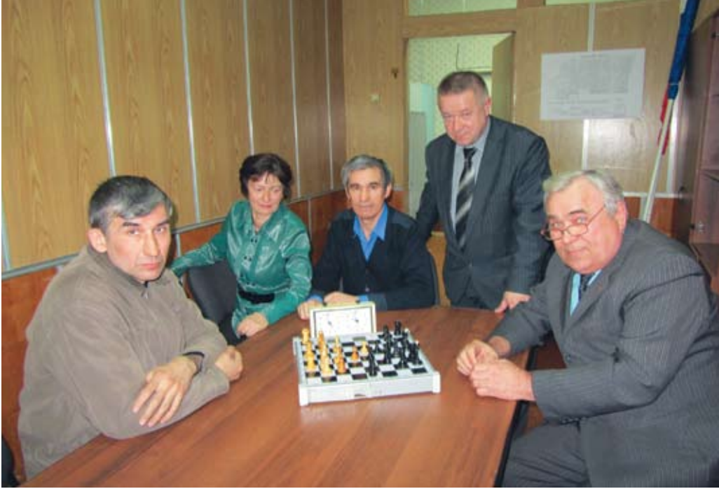
Стоит попросить попозировать — и шахматисты РИЗа сразу же увлекаются игрой

Шахматы, как и другие виды спорта, требуют постоянных тренировок. Ризовцы к камазовскому первенству готовились серьёзно — провели свой турнир, в нём приняли участие 17 шахматистов, а потом сразились с командой дизели-