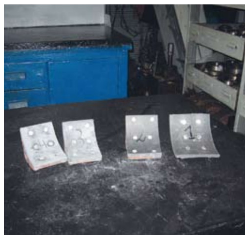
Задача для начинающих слесарей-ремонтников: какая деталь выполнена неправильно?

Участников конкурса восемь, задание сложное, и выявить лучшего будет непросто. Предстоит отремонтировать прибор и подключить его к электросети. Члены