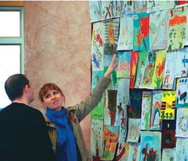
В экспозицию выставки вошло около 300 рисунков

Всего в экспозицию выставки вошло около 300 рисунков. Победители конкурса получают дипломы и билеты в цирк.