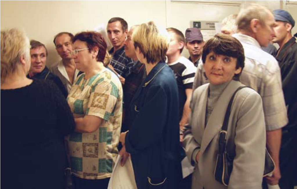
Очередь у кабинета профосмотра — знакомая картина? Но от тщательности его проведения зависит жизнь

— В первую очередь люди, чья работа связана с вредными факторами и опасными условиями труда. Медосмотр в обязательном порядке также проходят все водители транспортных средств, работники водопроводных сооружений («Челныводоканал»), пищевой промышленности, системы образования, соци-