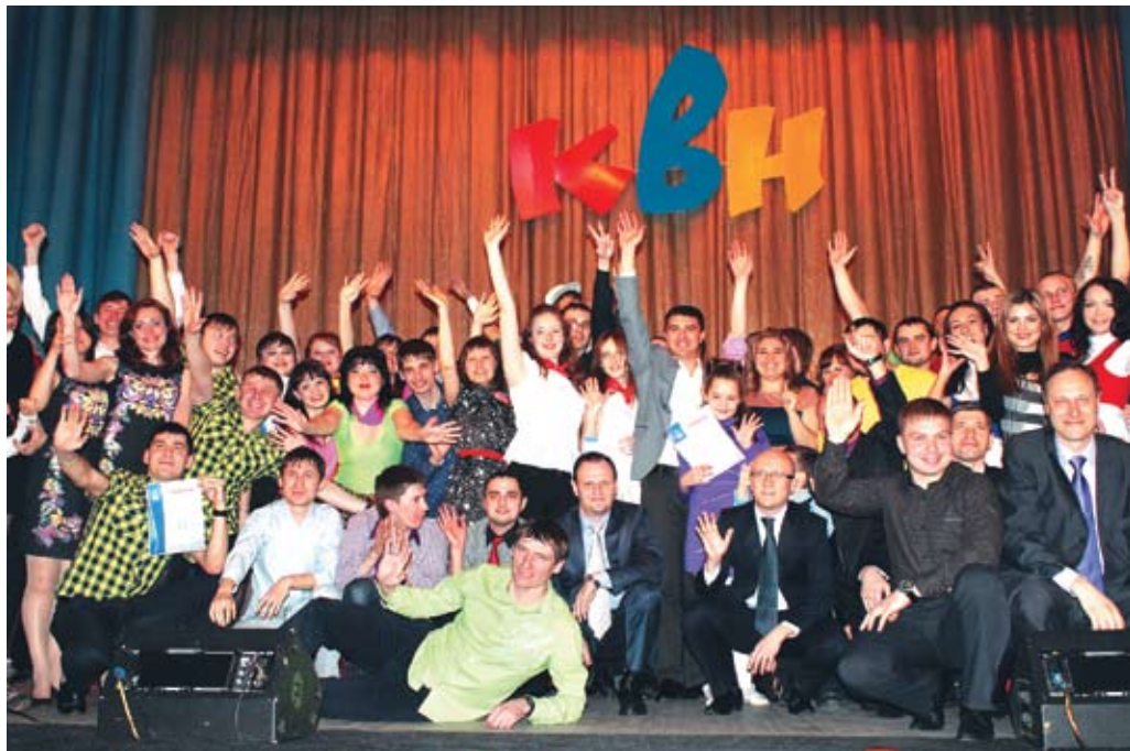
Золотой молодёжи — большое будущее

— А это как? — Вот смотри: КАМАЗы продавать нано? Нано! Склады осматривать нано? Нано! И теперь у нас нанопремия и нанозарплата.