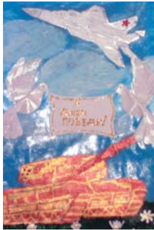
«С Днём Победы!»