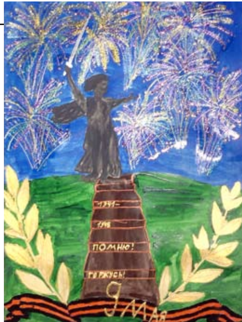
«Салют на Мамасовом кургане»