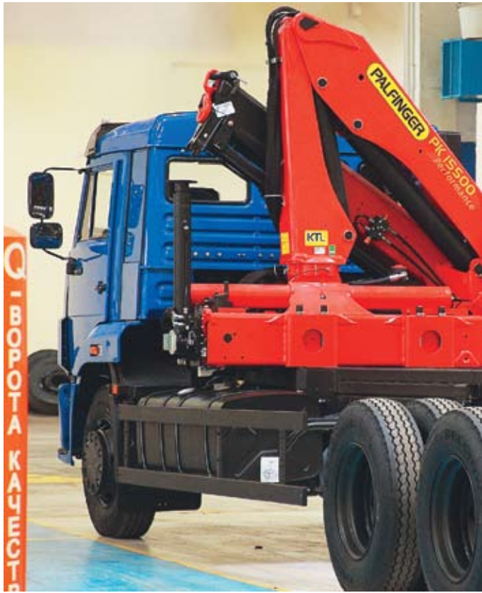
На производство автобусных шасси и надстроек участники семинара попали в момент испытаний новой продукции

Как известно, обратная связь — тот индикатор, который лучше всего может проиллюстрировать настроения и впечатления гостей. С несколькими из них нам удалось пообщаться по ходу семинара.