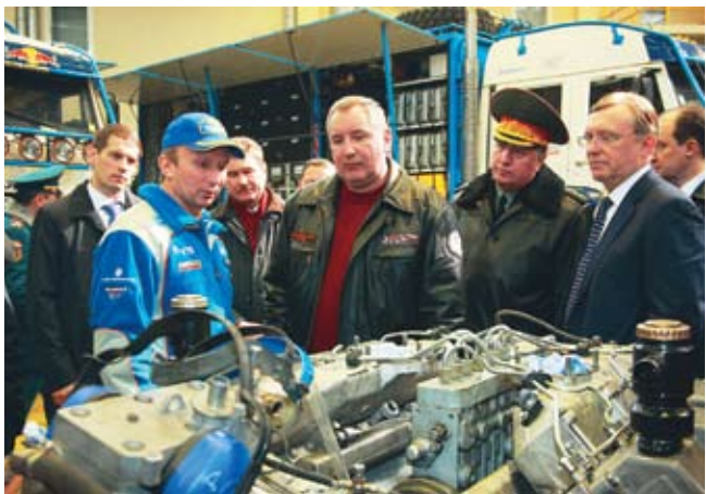
Гостю открыли секреты спортивных побед «КАМАЗ-мастера»

«Мы показали сегодня те современные технологии, которые пришли в последние годы на предприятие, показали центр разработок «КАМАЗа», поставили свои вопросы — нужен полигон, нужно решить некоторые вопросы на федеральном уровне, — сообщил Минниханов. — И я думаю, что это очень полезная поездка, в ходе которой мы сможем и получить новые задачи, и поставить свои вопросы перед руководством».