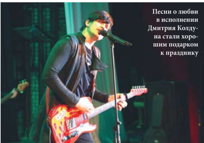
Песни о любви в исполнении Дмитрия Колдуна стали хоромшим подарком к празднику