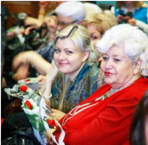
Для праздничного настроения важны и добрые пожелания, и весенние цветы

Узнать в фанатах леди, ещё пять минут назад одобрительно внимающих происходящему на сцене, было сложно. Видимо, любовь к хорошей музыке преобразает женщин любого возраста.