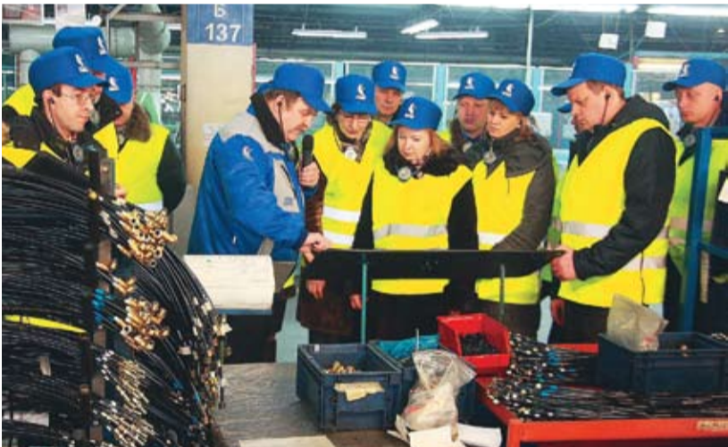
Вслед за представителями Куйбышевского и Свердловского филиалов ОАО «РЖД» на «КАМАЗ» прибыли гости из Нижнего Новгорода. В состав делегации РЖД вошли представители разных служб: ремонтники, энергетики, связисты, путейцы, технологи

Вчера на «КАМАЗе» побывали представители филиала ОАО «РЖД» Горьковского железной дороги. Как и многие гости автогиганта, в рамках дня открытых дверей они изучили опыт «КАМАЗа» в области внедрения принципов бережливого производства. Увидели, как работает Производственная система «КАМАЗ» на конвейере сборки кабин и главном сборочном конвейере, побывали в кайдзен-классах, изучили PSK в офисах и смогли получить ответы на все свои вопросы.