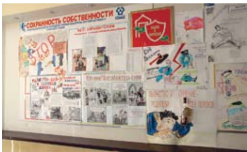
На плакатах — то, что рождает неприятности как в коллективе, так и в семье

...алкоголизма и курения» — именно под таким названием на заводе двигателей завершился конкурс стенгазет и плакатов.