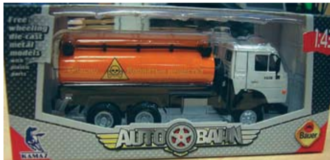
ООО «Бауер» привлечено к гражданско-правовой ответственности по ст. 1515 ГК РФ за незаконное использование фирменного камазовского знака

Вопрос по защите прав на интеллектуальную собственность традиционно связы-