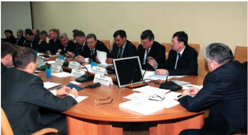
В своём кругу обсуждение «больных» тем было откровенным и отнюдь не комплиментарным