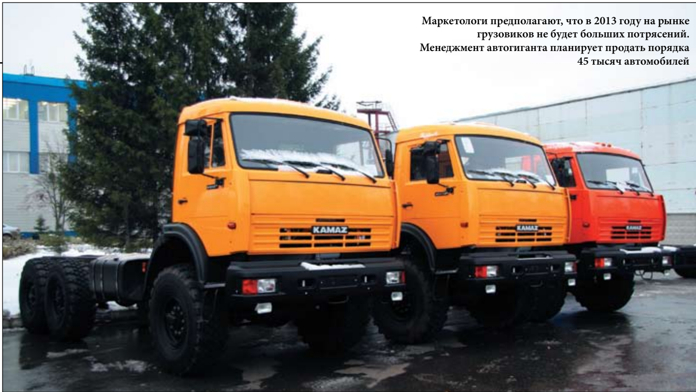
Маркетологи предполагают, что в 2013 году на рынке грузовиков не будет больших потрясений. Менеджмент автогиганта планирует продать порядка 45 тысяч автомобилей