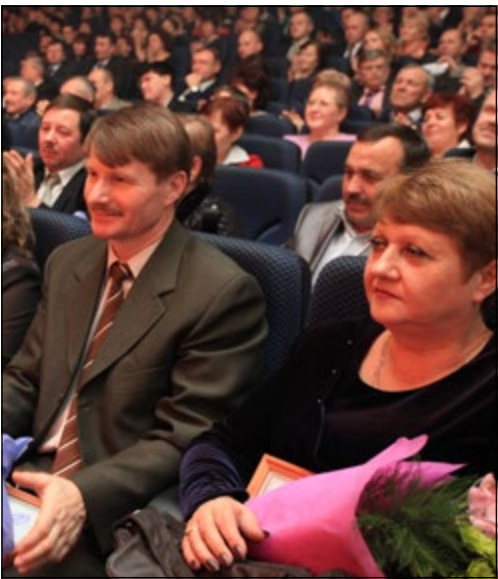
Вот они, герои праздника

Мы с нетерпением ждём старта гонки и обязательно будем следить за развитием событий.