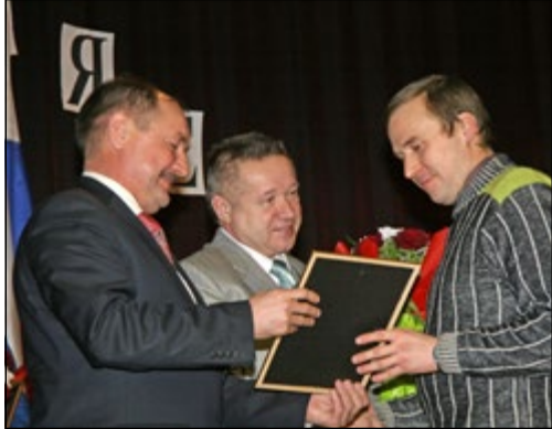
По итогам работы в 2012 году лучшие инструментальщики получили почётные звания...

Камазовские инструментальщики вчера отметили профессиональный праздник.