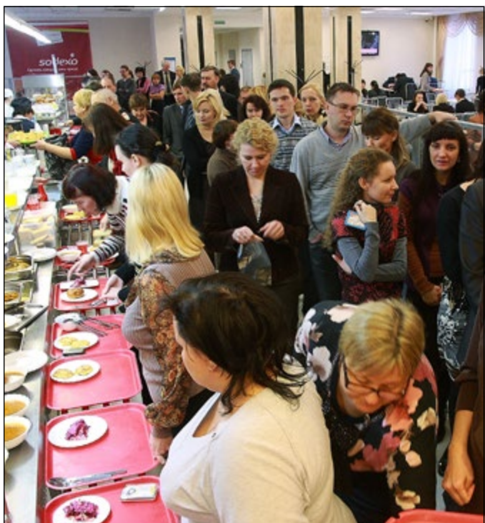
Ожидание в очереди занимает львиную долю обеденного времени