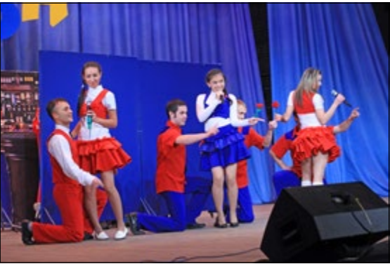
Команда «Полный привод» не закупает ни свечки, ни спички, ни консервы. А только мандарины, шампанское и хлопнушки. И поздравляет всех с наступающим!