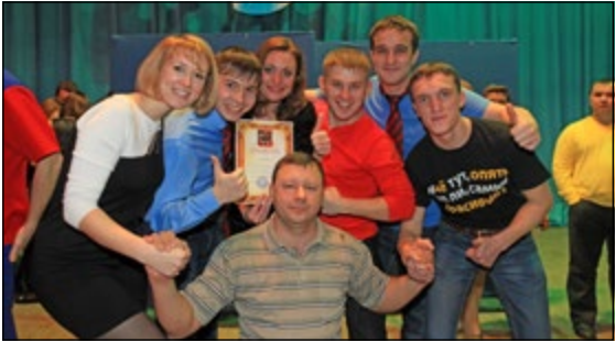
Команда НТЦ «Мы из центра» – лучшая команда фестиваля

Папа мой взял ипотеку, в кредит – «Приору Ладу», Маме – норковую шубу. Она будет очень рада. Ещё мы едем на Гоа в следующее лето. Папа мой надеется, что будет конец света.