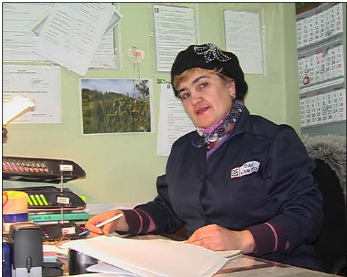
Взгляд, посадка головы – чем не «Незнакомка» Крамского?

– Специалист она очень хороший. На каком бы складе не был какой-то прорыв, она справится. Склады у нас все разные по своей специфике, но она ориентируется в любых ситуациях. Бывает, что машина пришла, а погрузчика нет. Она и погрузчик найдёт, и людей организует – молодец, одним словом. Как бригадир она на своём месте. А как человек, наверное, ещё лучше. Не со всеми вопросами могут ко мне подойти как к мастеру, а к ней все тянутся: и молодёжь, и старые работники.