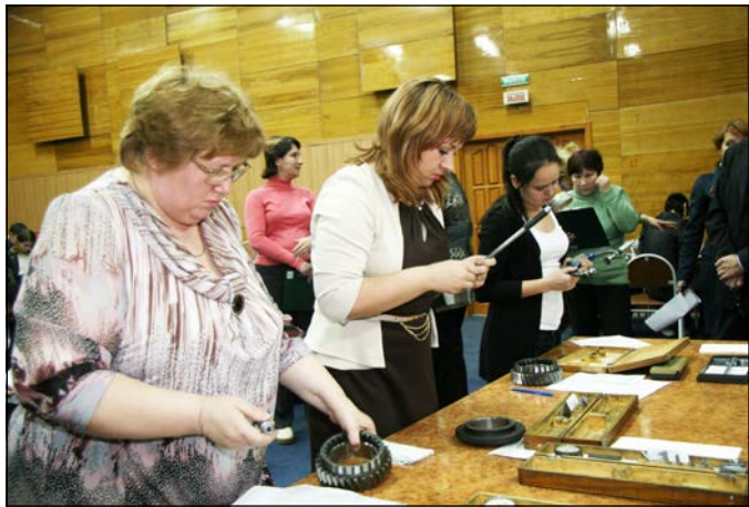
Все задания конкурса – из камазовской практики

Свой профессиональный праздник – Всемирный день качества – специалисты службы качества, аудиторы и контролёры отмечали качественной игрой.