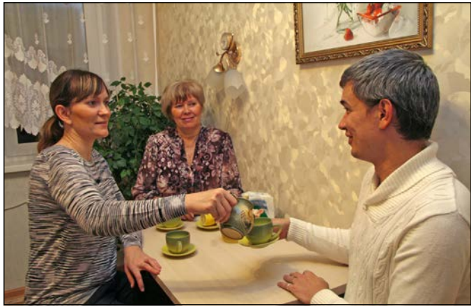
Что может быть лучше уютного домашнего чаепития у мамы?

В России День матери стали праздновать сравнительно недавно – Указом Президента Российской Федерации Б.Н. Ельцина от 30 января 1998 года № 120 «О Дне матери» праздник отмечается в последнее воскресенье ноября. Замечательно, что этот праздник существует: сколько бы хороших, добрых слов мы ни говорили нашим мамам, лишними они не будут.