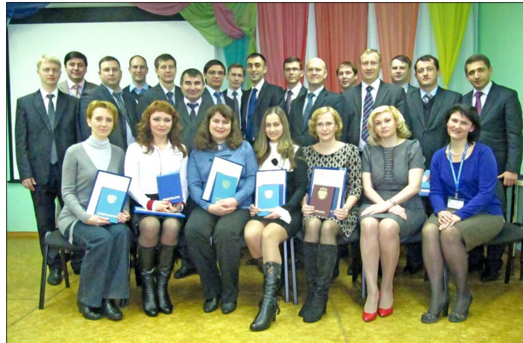
Дипломы Открытого университета Великобритании вручены руководителям предприятий и подразделений «КАМАЗа»

Стать обладателем «корочки» британского университета, не выезжая из города и без отрыва от работы? Камазовцы с помощью родного предприятия не упустили шанс получить престижное образование, появившийся у них благодаря школе бизнеса «КАМА-ЛИНК».