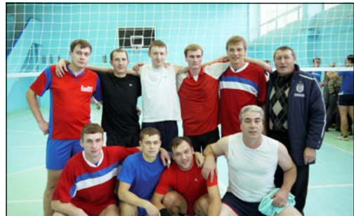
Лучшие игроки в волейбол сезона-2012 – в команде ПРЗ

Спортсмены пресово-рамного завода заняли первую ступеньку пьедестала почёта в турнире по волейболу, проходившему в рамках Спартакиады «КАМАЗа», став лучшими среди 19 мужских и четырёх женских команд. Лишний повод убедиться, что спортивные победы куются упорным трудом на тренировках.