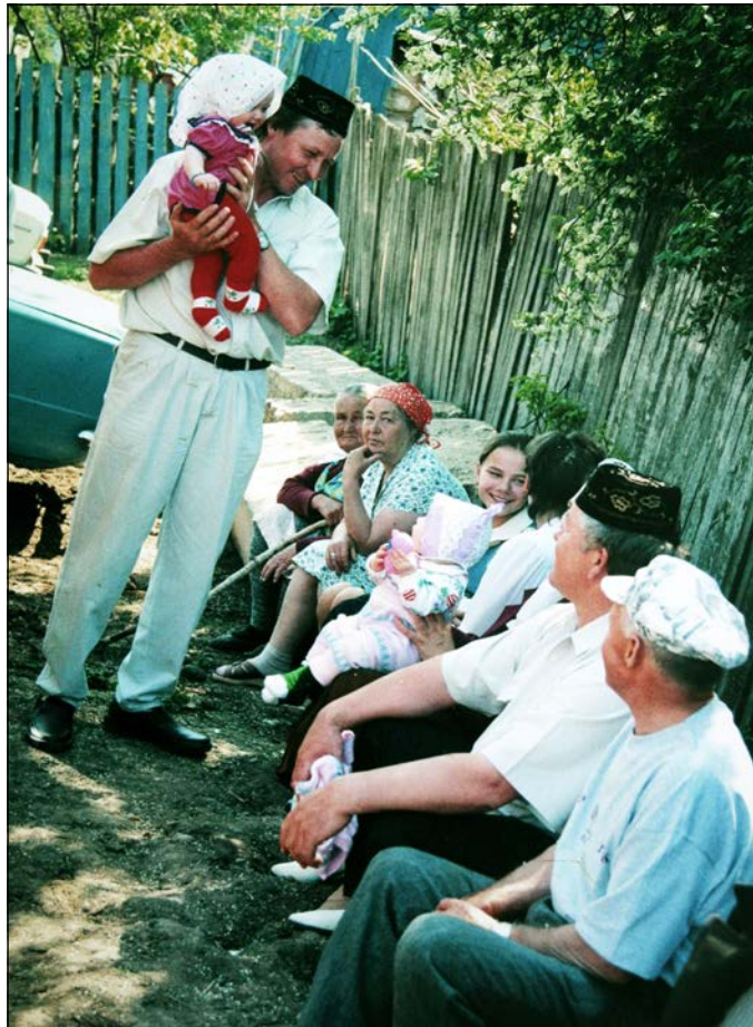
Благополучие во всех смыслах – это ли не достойная осень жизни?

С 1 июля действует Федеральный закон № 360-ФЗ «О порядке финансирования выплат за счёт средств пенсионных накоплений». Граждане, у которых формируются пенсионные накопления, при наличии оснований имеют право подать заявление в пенсионный фонд на назначение и выплату накопительной части трудовой пенсии.