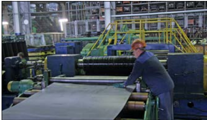
Стальной рулон сейчас пойдёт под ножи станка

– Значительно улучшить качество затяжки позволят новые гайковёрты, которые будут установлены на позициях, где производится затяжка особо ответственных соединений. К ним относятся затяжки колёс автомобилей, гаек крепления балансирной подвески на автомобилях тяжёлого ряда и гайки крепления сошки рулевого механизма. До этого те же колёса при установке затя-