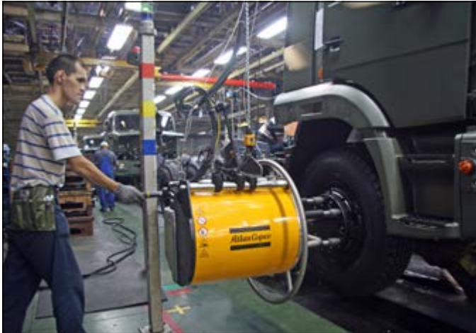
Электрические многошпиндельные гайковёрты Atlas Corso помогают значительно повысить качество затяжки

Благодаря этому кайдзен-проект теперь на продольную линию заготовительного цеха закапуют металл не на 62 млн рублей в месяц, а на 54-56 млн рублей. Экономическая польза очевидна. Да и, кроме того, стал нагляднее заметен эффект от системы «Канбан», позволяющей избежать излишних запасов.