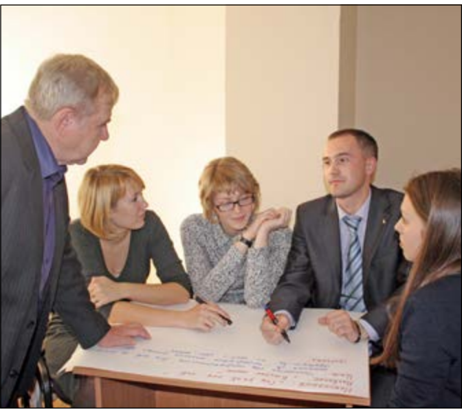
В рамках семинара был организован тренинг для участников конкурса