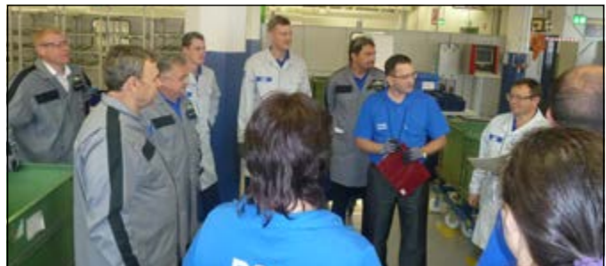
На кайдзен-сессии решается, как и что надо улучшить, чтобы достичь поставленных целей

ров до начальников цехов и мастеров. «Программа-максимум» предусматривает также обучение партнёров, поставщиков. Одновременно в двух группах, процессной и офисной, смогут обучаться до 30 человек, сессия рассчитана на срок от двух до пяти полных рабочих дней. Уже сегодня разрабатываются новые курсы – такие, как TPM, SMED и т.д. Открытие «Фабрики процессов» станет ещё одним шагом в развитии PSK, элементом глубокого вовлечения в Lean, который будет выгодно отличать нас от многих компаний автомобильной отрасли в области подготовки нашего персонала лин-технологиям, способствовать изменению философии жизни и управления предприятием.