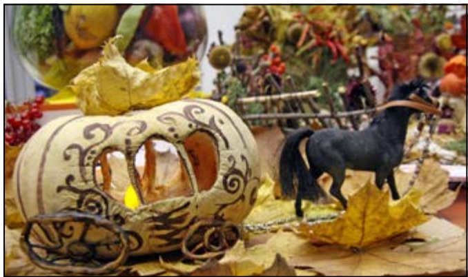
Вот такой лимузин подарили Золушке работники ДУСа