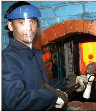
Главная задача на сегодня – бесперебойно изготавливать необходимое количество отливок без брака и обеспечивать ими все производство «КАМАЗа»

участков, с бригадами, мастерами будут комплексно решать проблемные вопросы с использованием всех инструментов «Бережливого производства». Эти участки