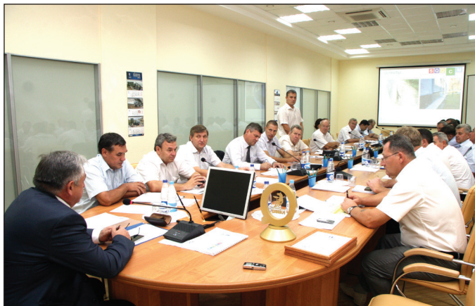
В повестке дня нашла отражение практически вся тематика, входящая в аббревиатуру SQDCM

ремонту подлежит почти 2 млн кв. м кровли, за минувшие 10 лет 641 тысяча кв. м отремонтирована, что обошлось компании в 1,3 млрд рублей. В нынешнем году запланировано привести в нормальное состояние 73 тыс. кв. м кровли на сумму 132 млн руб. Фактическое выполнение – 52 тыс. кв. м, освоено 99 млн рублей. Миллионы отпущены и на остекление (основной объём работ намечен на август),