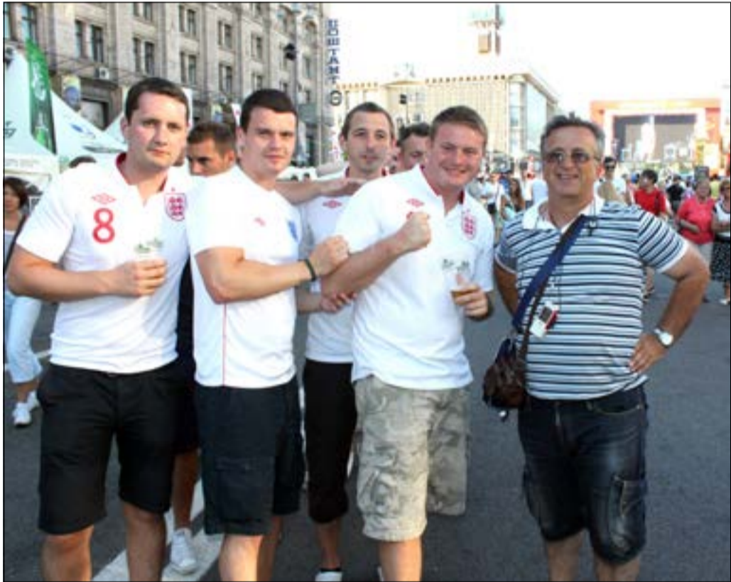
Английские болельщики, самоотверженно поддерживая за свою команду, демонстрировали уважение и к своим соперникам. Перед началом матча они активно приветствовали своих спортсменов, а затем дружно аплодировали гимну Украины

– Вокруг «Евро-2012» ходило множество слухов, жителей некоторых стран даже призывали бойкотировать его матчи, проходившие на Украине. Мы ни разу не почувствовали холода недоверия. Соседи встречали гостей радушно, приветливо, а России ещё предстоит сдать экзамен на гостеприимство, – въздыхает Николай Вениаминович.