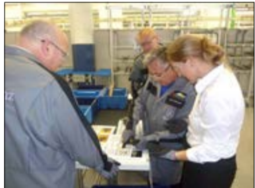
На фабрике процессов учат применять на практике основные инструменты Лин-менеджмента

Такое обучение прошли и камазовцы с 26 по 28 июня. Мы решили узнать у участников группы, что они вынесли для себя после тренингов на фабрике процессов и что уже сегодня возможно применять в работе.