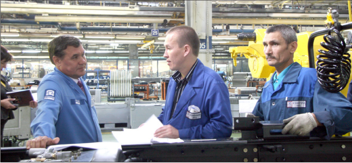
Каждый рабочий день директора автомобильного завода начинается с участка, где собирают автомобили с двигателем «Евро-4»

Новая организация подготовки производства поможет сэкономить время на освоении новых моделей. Если бы работа велась по привычной схеме, после отработки процесса в условиях НТЦ пришлось бы ещё раз проходить этот путь в процессе производства.