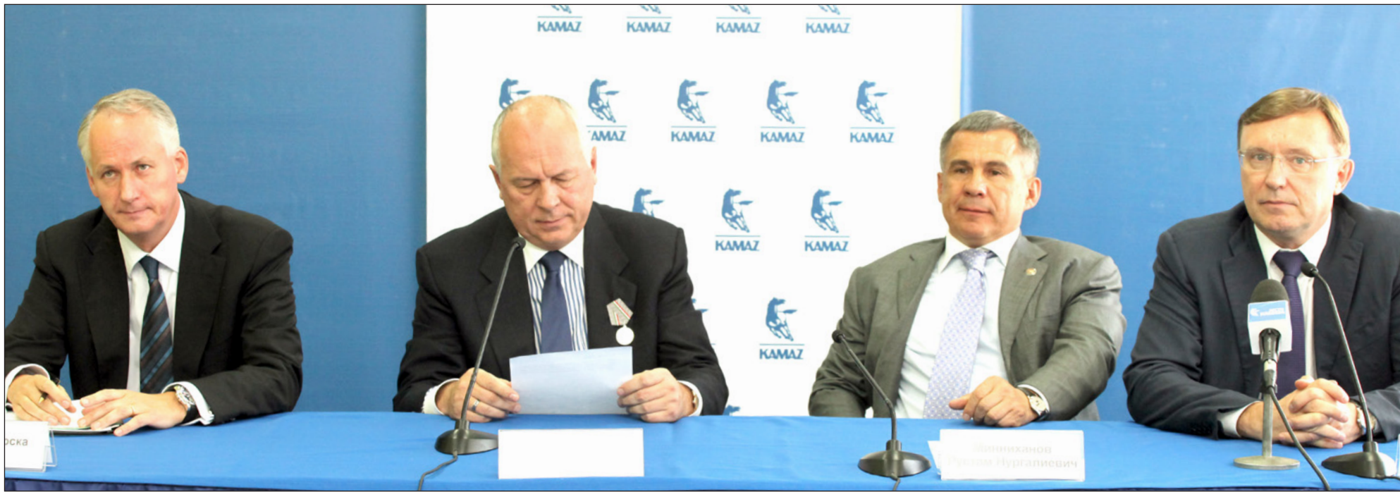
На пресс-конференции журналисты интересовались у её участников взаимоотношениями автогиганта с «Даймлером», переговорами с «МАЗом»

Традиционно годовое общее собрание акционеров «КАМАЗа» завершилось пресс-конференцией, в которой на вопросы федеральных, республиканских и городских СМИ ответили основные акционеры компании и представители республиканских властей. Представляем вашему вниманию основные моменты этого мероприятия.