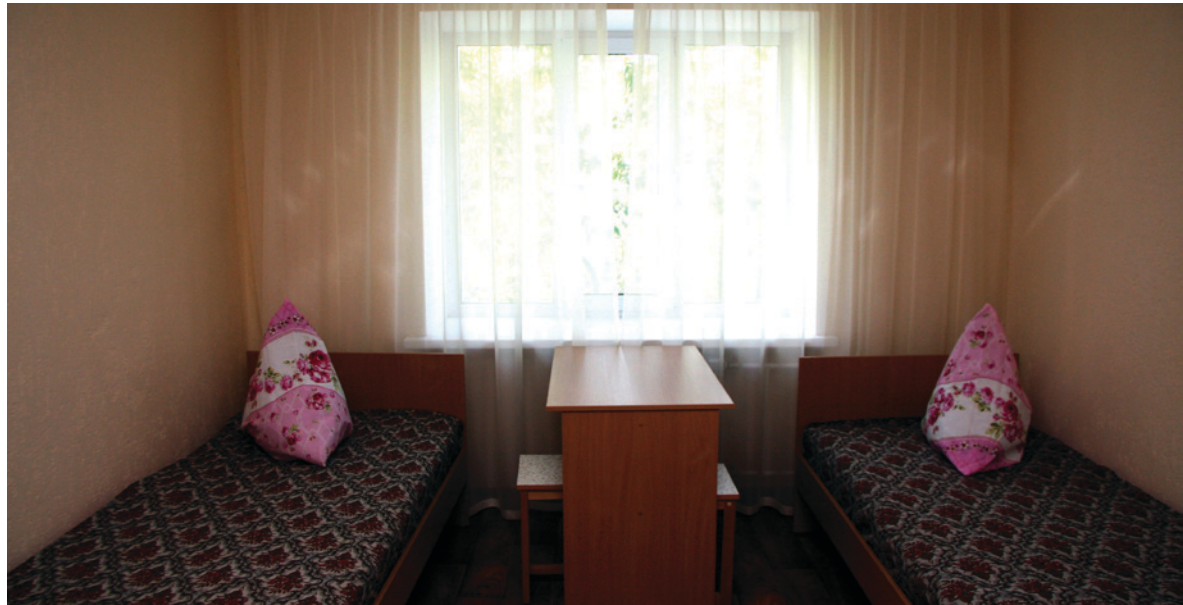
Свежеотремонтированные помещения ждут своих новых жильцов