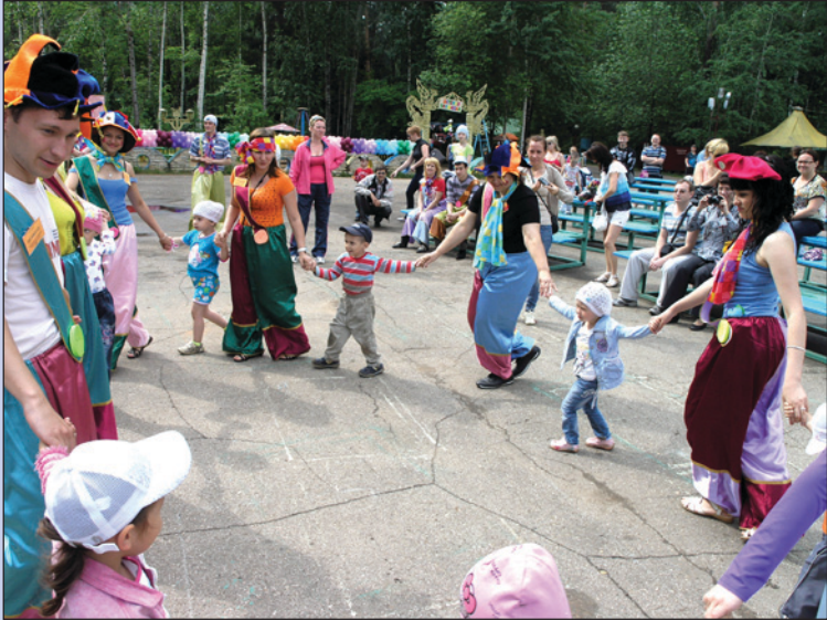
Только на таком празднике можно вдоволь повеселиться и детям, и взрослым!

2 июня состоялось открытие летнего сезона на базе отдыха «Литейщик». По традиции начало лета совпало с замечательным весёлым праздником – Днём защиты детей.