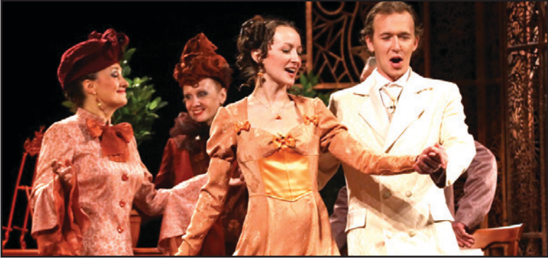
Сцена из спектакля «Пыль в глаза»

С 25 по 28 июня в ДК «КАМАЗа» пройдут гастрели Казанского академического русского драматического театра имени В.И. Качалова. Эта театральная неделя по доброй традиции является подарком камазовцам, который им преподносят администрация автогиганта, труппа Качаловского театра и Дворец культуры «КАМАЗ».