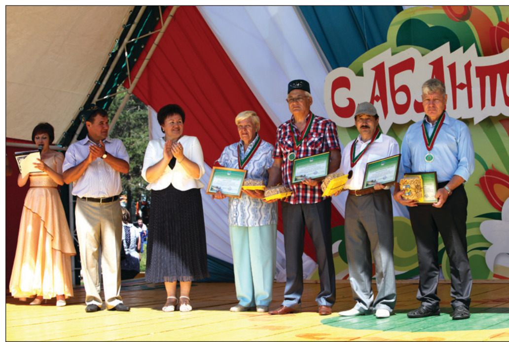
В рамках Года истории в РТ на Сабантуе были вручены награды журналистам, краеведам, представителям музеев