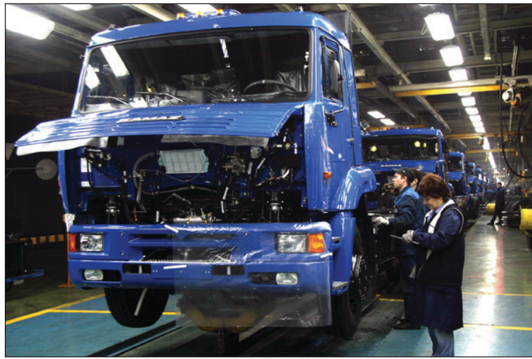
На многих заводах «КАМАЗа» созданы все условия для комфортной и продуктивной работы

Включение волгоградцев в процесс началось со знакомства с глоссарием «Бережливого производства». Поначалу представители среднего звена руководителей и линейного персонала не поверили в возмож-