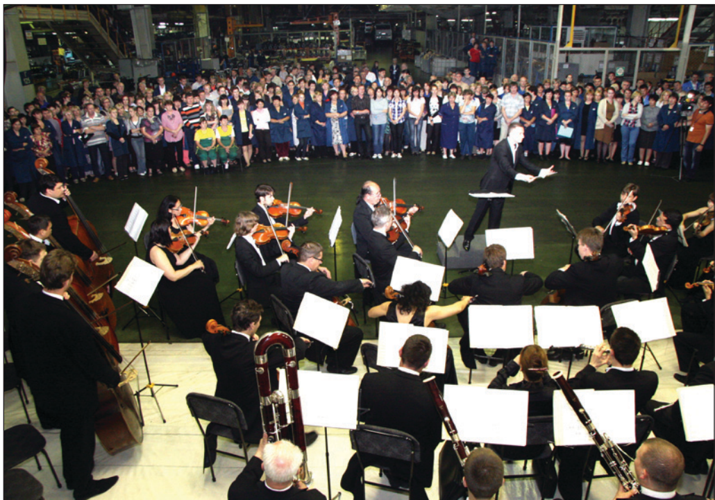
Автомобильный завод – самая необычная площадка, на которой приходилось выступать музыкантам

Музыканты пообещали дать на заводе ещё не один концерт: «Приезжая в Набережные Челны, обязательно будем навещать «КАМАЗ»!