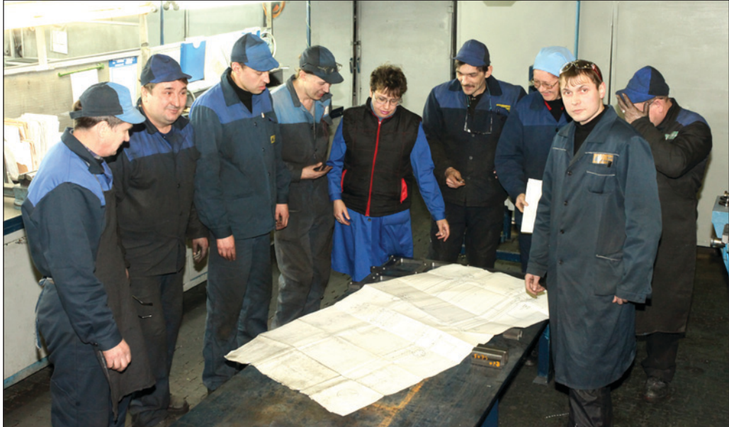
Подручному повезло: его окружают классные специалисты и хорошие люди