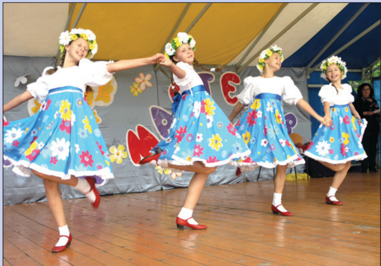
Свои умения продемонстрировали участники хореографического ансамбля «Щелкунчик» детской школы искусств

Не оставила никого равнодушным и музыкальная зарядка по мотивам сказки «Красная Шапочка». Можно было только умиляться, как мальчишки и девочки, а также их родители с задором выполняли указанные инструктором упражнения. Где ещё, как не на таком празднике, взрослые смогут позволить себе расслабиться, вспомнить детство, отдохнуть и подучиться?