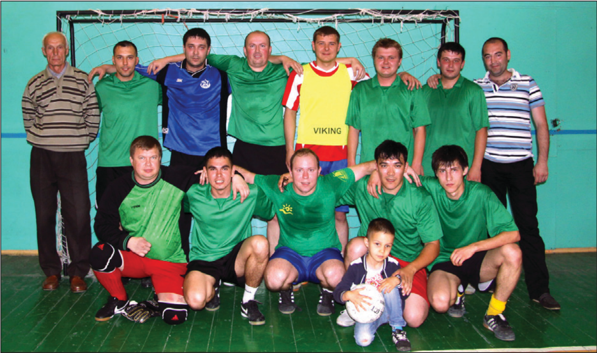
Команда завода двигателей – чемпион ОАО «КАМАЗ» по мини-футболу 2012 года

Несомненным фаворитом в матче литейного завода и Филиала «Татарстан» считалась команда литейщиков, которая к последнему дню чемпионата набрала 10 очков, в то время как Филиал «Татарстан» не выиграл ни одного матча. В случае по-