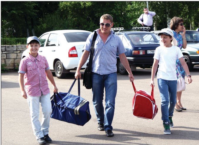
Настоящие мужчины всегда помогают друг другу

Поводов для волнений должно быть ещё меньше и потому, что с детьми будут работать достаточно опытные вожатые. Хотя многие из них пока студенты, но в лагерь едут работать не первый год.