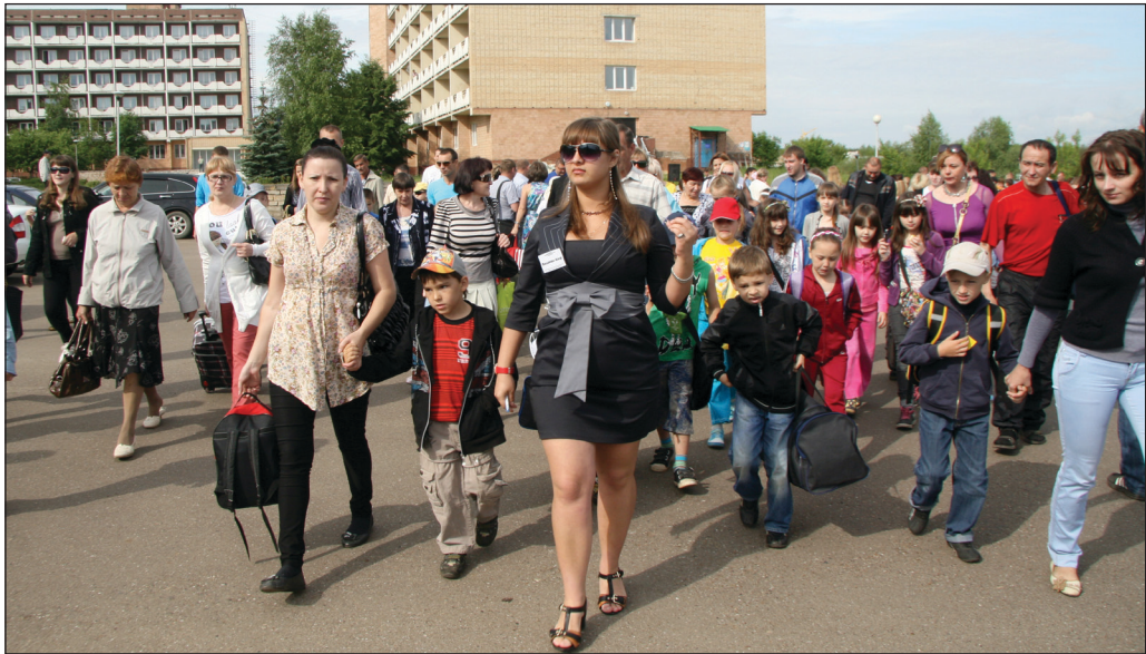
Идём за организатором!

Традиционно в первые дни лета площадь перед профилакторием «Набережные Челны» заполняется весёлой ватагой школьников – ребята отправляются в оздоровительные лагеря. Не стал исключением и этот год – 4 июня в оздоровительных лагерях камазовского комплекса «Саулык» стартовала первая смена.