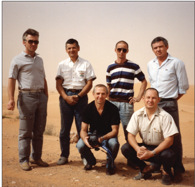
Камазовцы стали первыми в СССР, кто ступил на землю Саудовской Аравии

А попали они в Саудовскую Аравию не без приключений. После посадки самолёта в аэропорту страны на борт «Боинга» поднялась группа военных и попросила камазовскую делегацию выйти из самолёта первой. Старший от группы военных собрал паспорта членов делегации «КАМАЗа», без таможенного досмотра усадил всех в машины и повёз ночью в неизвестном направлении, причём