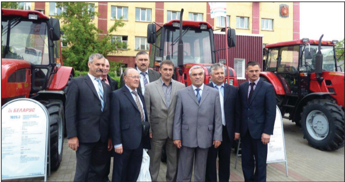
Камазовская делегация на Минском тракторном заводе

И всё же на производстве необходимо наводить порядок. Вдоль конвейера стоят огромные тары с недельным запасом запчастей, специальных приспособлений для хранения комплектующих нет, логистика развита слабо. Белорусам срочно нужно браться за внедрение Производственной системы!