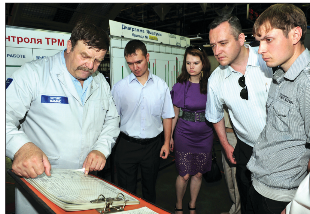
Задача мастеров – сделать рабочие места в своих цехах более удобными и безопасными