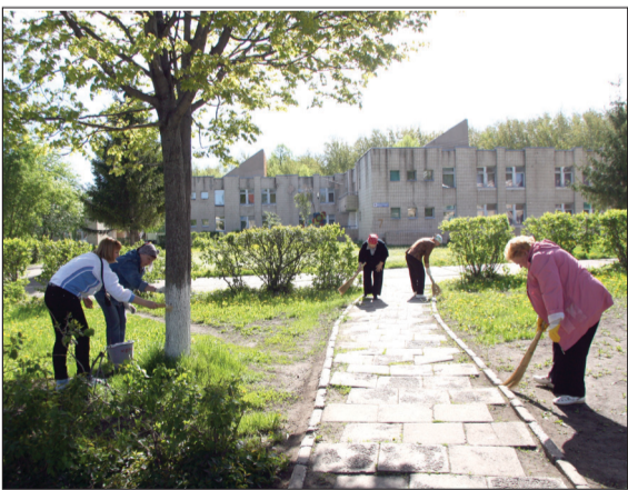
Идёт подготовка к заезду детей

Первыми представили свои концертные номера сотрудники службы главного инженера. Жюри будет оценивать исполнительское мастерство, артистичность, режиссуру выступления. Самые лучшие номера зрители увидят на итоговом гала-концерте, где победителей наградят ценными призами.