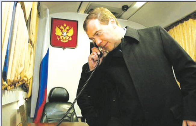
Приёмная на колёсах уже не раз проходила проверку в деле

В ходе визита в Самарскую область действующий Президент России Дмитрий Медведев осмотрел вполне обычный городской полунизкопольный автобус НЕФАЗ-30-32 на шасси КАМАЗ с двигателем Cummins. Но «обычный» только на первый взгляд: на самом деле это целый мобильный комплекс для осуществления приёма обращений и жалоб граждан.