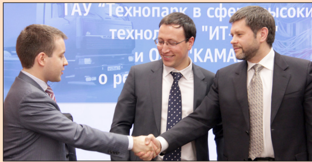
(Подробности – в следующем номере).