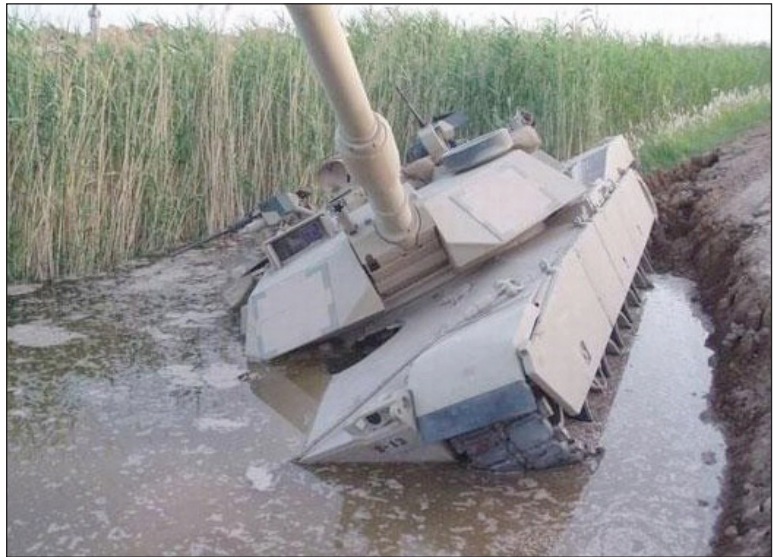
Российские дороги – мощное оружие против НАТО

Утерянное свидетельство о регистрации серии ВВ № 213158 от 27.09.2003 г. на прицеп 2ПТС-4М считать недействительным.