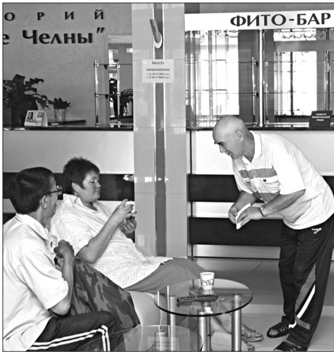
В клинике-санатории «Набережные Челны» в 2011 году поправили своё здоровье 1624 человека. На путёвки для камазовцев направлено более 37,5 млн рублей

разрабатывать коллективный договор ОАО «КАМАЗ» на 2013 и 2014 годы. С одной стороны, от нас потребуются продуктивное взаимодействие сторон, подписывающих этот важный документ. С другой стороны, наша задача – повышение производительности труда и снижение энергоёмкости производства, результатом чего будет конкурентоспособная продукция и достойная заработная плата.