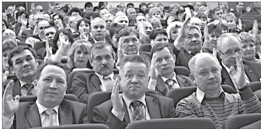
Все решения конференции принимались делегатами единогласно

Был поднят вопрос о проходной термогальванического производства. Работники просят разрешения заходить к себе в корпус через проходную ТФК, поскольку это удобнее. «Я не вижу больших препятствий, чтобы этот вопрос решить достаточно быстро и положительно», – резюмировал генеральный директор.