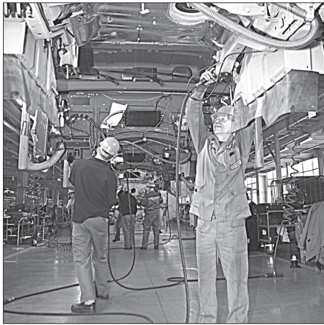
Начиная с четвёртого квартала 2011 года, с конвейера автомобильного завода ежесуточно сходит 240 автомобилей

Многое сделано, но ещё больше предстоит сделать. Необходимо обустроить раздевалные помещения