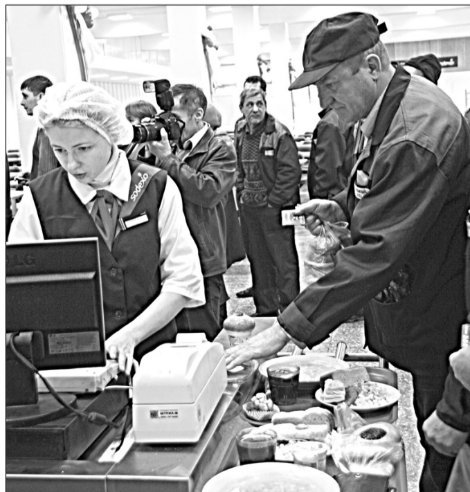
Вручая чек в столовой, каждый кассир желает камазовцам приятного аппетита

– Мы выполнили все обязательства по предоставле-