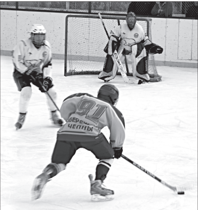
Финальная игра команд «Огонёк» и «Белые медведи» выдалась захватывающей и зрелищной

По окончании матча состоялось награждение участников турнира. Команды-победители получили медали, грамоты и ценные призы. Организаторами турнира были отмечены и лучшие игроки в каждом амплуа: бомбардир, вратарь, нападающий и защитник. Турнир удался на славу, каждый из участников получил заряд положительных эмоций, а самое главное – опыт, который пригодится им в будущем.