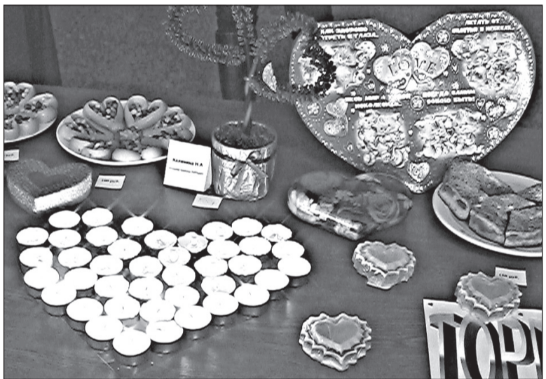
У экспозиции ТОРПИМН все изделия – в форме сердечек

– Это один из самых любимых праздников, ведь мы так редко собираемся вместе, – признаётся Лилия. – Жаль, что сутки такие короткие... Будь в них хотя бы 28 часов, я бы всё бонусное время проводила со своими родными!