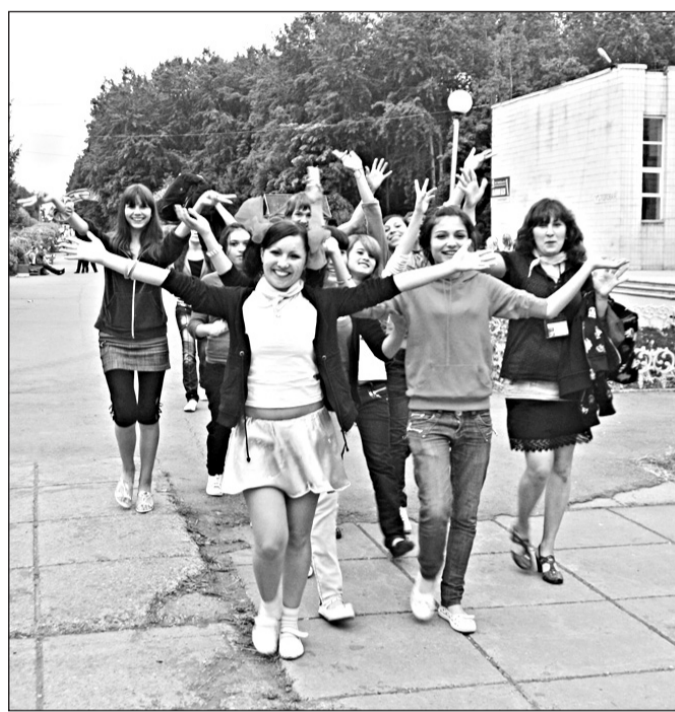
Дети работников компании отдохнули в детских лагерях «Солнечный» и «Крылатый» оздоровительного комплекса «Саулык». Общая сумма финансирования составила 15 млн 788 тысяч рублей

потери от брака. В эту сумму входит не только «пустой», бесполезный труд самих работников, но и расходы электроэнергии, металла, сырья, материалов, а также сверхурочно отработанное время в выходные, нерабочие, праздничные дни. Доля последнего в прошлом