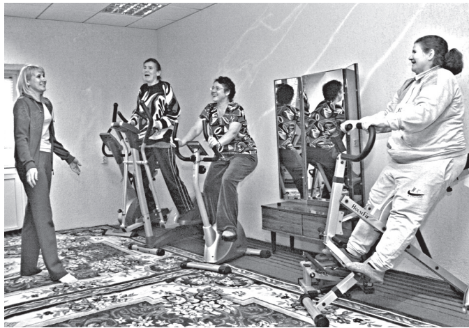
Состояние пациентов за время лечения значительно улучшается

Для меня всегда было очень важно, чтобы работа мне нравилась, я никогда не стремился к карьере. Именно на «КАМАЗе» мне интересно работать, за годы службы я подал более 200 рацпредложений. И делал это не ради денег, просто хочется, чтобы их внедрение пошло на пользу делу.