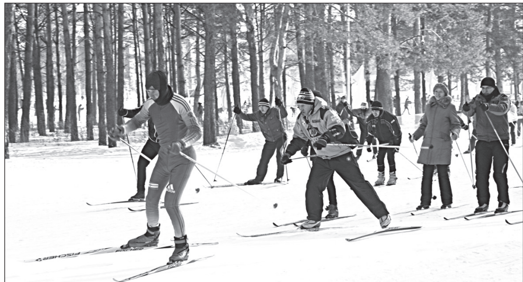
«Лыжня России» – это не просто соревнование, а настоящий праздник, на котором место найдётся всем