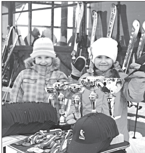
Настоящими спортсменами-горнолыжниками смогли почувствовать себя ребята от семи лет