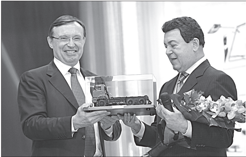
Подарок артисту и депутату на долгую добрую память

Торжество, посвящённое сборке двухмиллионного автомобиля, с автомобильного завода переместилось в стены ДК «КАМАЗа». Приглашения на праздничный вечер получили не только работники компании, но и ветераны, строившие заводские корпуса, монтировавшие оборудование, провожавшие в путь своего такого желанного первенца. Для них искрилось в этот вечер в бокалах победное шампанское, а они радовались встрече с коллегами и лукаво улыбались молодым.