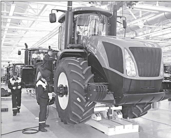
На таком современном тракторе собирать урожай и прощ, и приятнее

нистерство сельского хозяйства РТ и CNH-KAMAZ Industrial BV подписали меморандум о взаимопонимании.