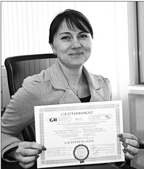
Профессиональный переговорщик тоже должен иметь диплом

соб решения споров может применяться в разных ситуациях: при несвоевременной оплате, поставках некачественного товара. Используя процедуру медиации, можно урегулировать конфликт между работниками и эмоциональное противостояние между подразделениями. Медиация может быть эффективно применена на при внедрении проектов, при-