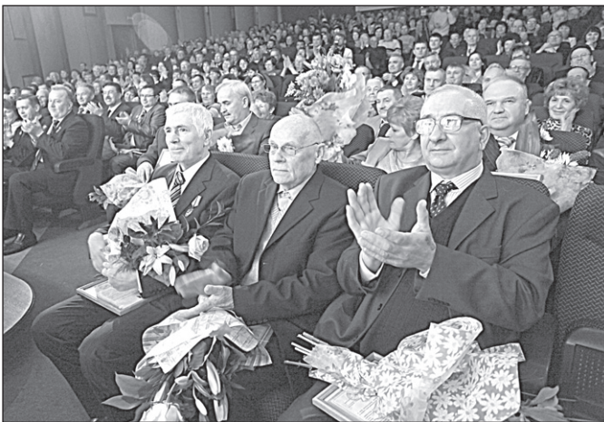
Настроение – отличное!

В благодарность за выступление генеральный директор ОАО «КАМАЗ» Сергей Когогин вместе с букетом преподнёс Иосифу Кобзону модель двухмиллионного автомобиля и пригласил его на следующий юбилей: «Мы постараемся сделать ещё полмиллиона достаточно быстро».