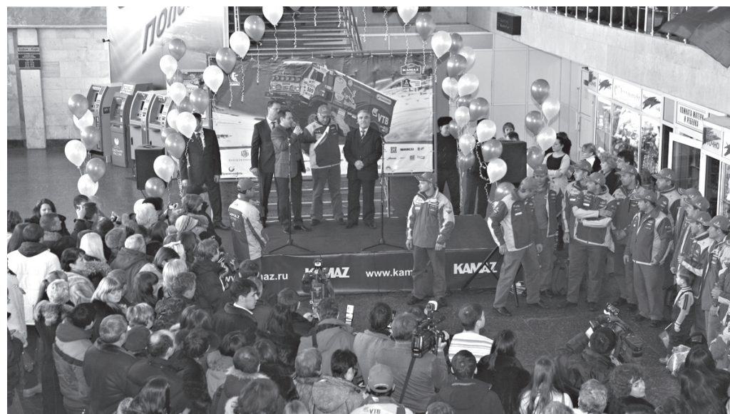
Встреча команды в аэропорту Бегеишево

Позади 33-й ралли-марафон и двухнедельные изнурительные испытания, полные драматизма и переживаний. «Дакар-2012» уже назвали одним из самых трудных испытаний для всех классов техники и людей, решивших бросить вызов Южной Америке. За плечами участников гонки почти девять тысяч километров, две из которых прошли в новых условиях перуанских джунглей, коварной «зыбучей пудры» и настоящих болот. Да, это было испытанием! И наши ребята его с достоинством преодолели.