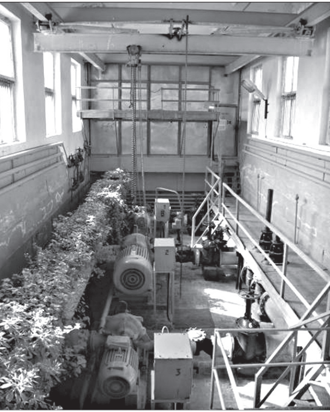
Станции, на содержание которых требовалось около шести миллионов рублей, теперь законсервированы