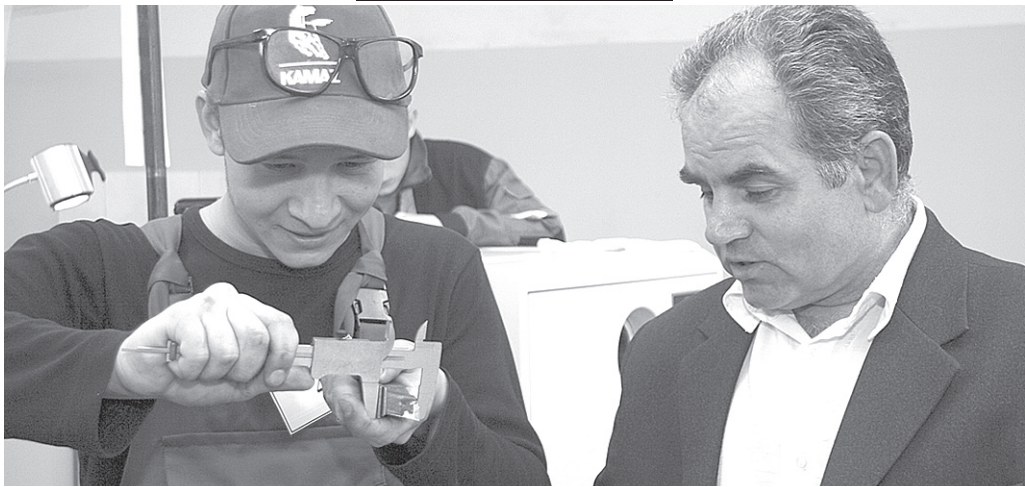
П. Мазур: «Конкурсанты работают грамотно»