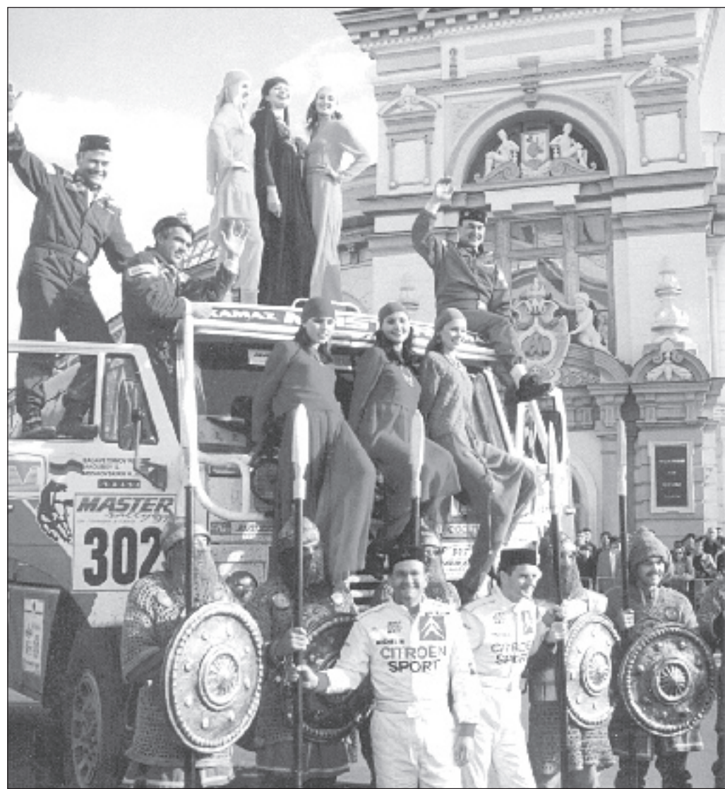
5 сентября 1997 года: Казань встречает участников «Мастер-ралли-97»

Представители 31 страны мира примут участие в международном марафонском ралли-рейде «Шелковый путь-2009 – серия Дакар». О подготовке и проведении ралли-рейда говорили на днях в Кабинете министров Республики Татарстан на заседании оргкомитета гонки, которое провел Премьер-министр РТ Рустам Минниханов.