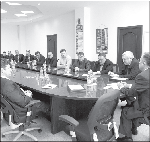
(Окончание. Начало – на 1-й стр.)