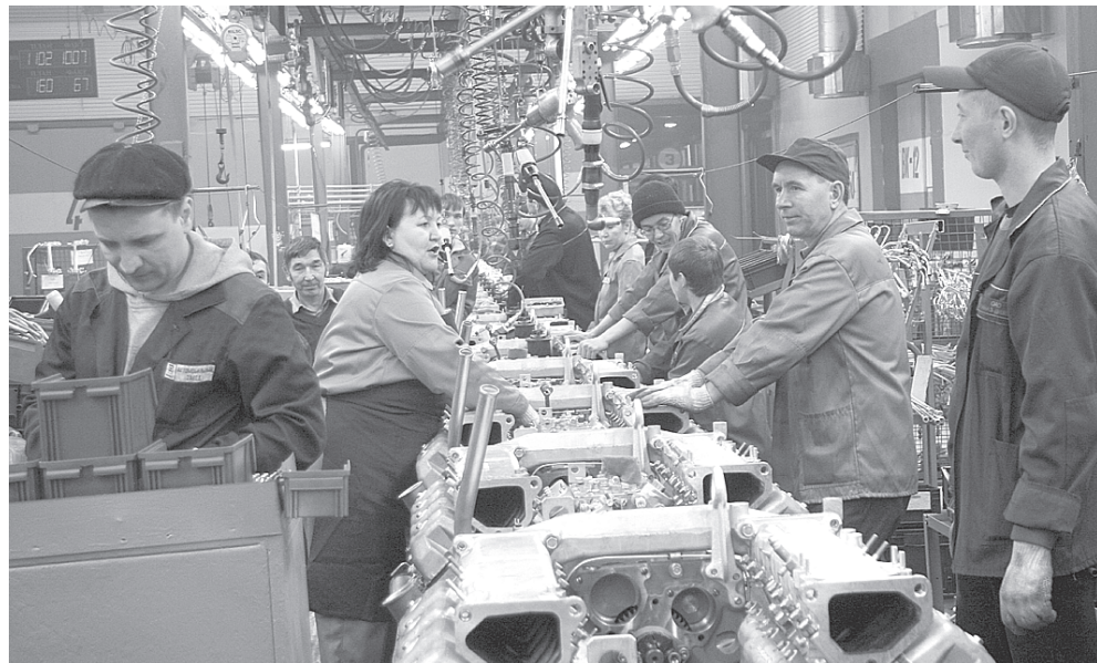
(Окончание. Начало – на 1-й стр.)

Мы готовы своевременно выполнять заказы наших потребителей, постоянно расширять модельный ряд и производить высококачественную продукцию мирового уровня. ОАО «КАМАЗ», российский автопром готовы решать транспортные проблемы страны.