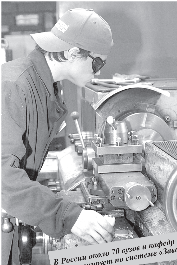
В России около 70 вузов и кафедр функционирует по системе «Завод-втуз».

Извечная проблема как совместить теорию с практикой в системе технического образования была решена англичанами еще в 1890 году, когда они создали первые учебные заведения, студенты которых примерно половину учебного времени проводили на заводах и фабриках. Система, окрещенная ныне «интегральным обучением», или системой «Завод-втуз», перекочевала в Америку, где сейчас в этом режиме работает около тысячи технических вузов. В России эта цифра скромнее: около 70 вузов и кафедр у нас в стране функционирует по системе «Завод-втуз». Первое и старейшее учебное заведение – Петербургский институт машиностроения (ПИМаш),