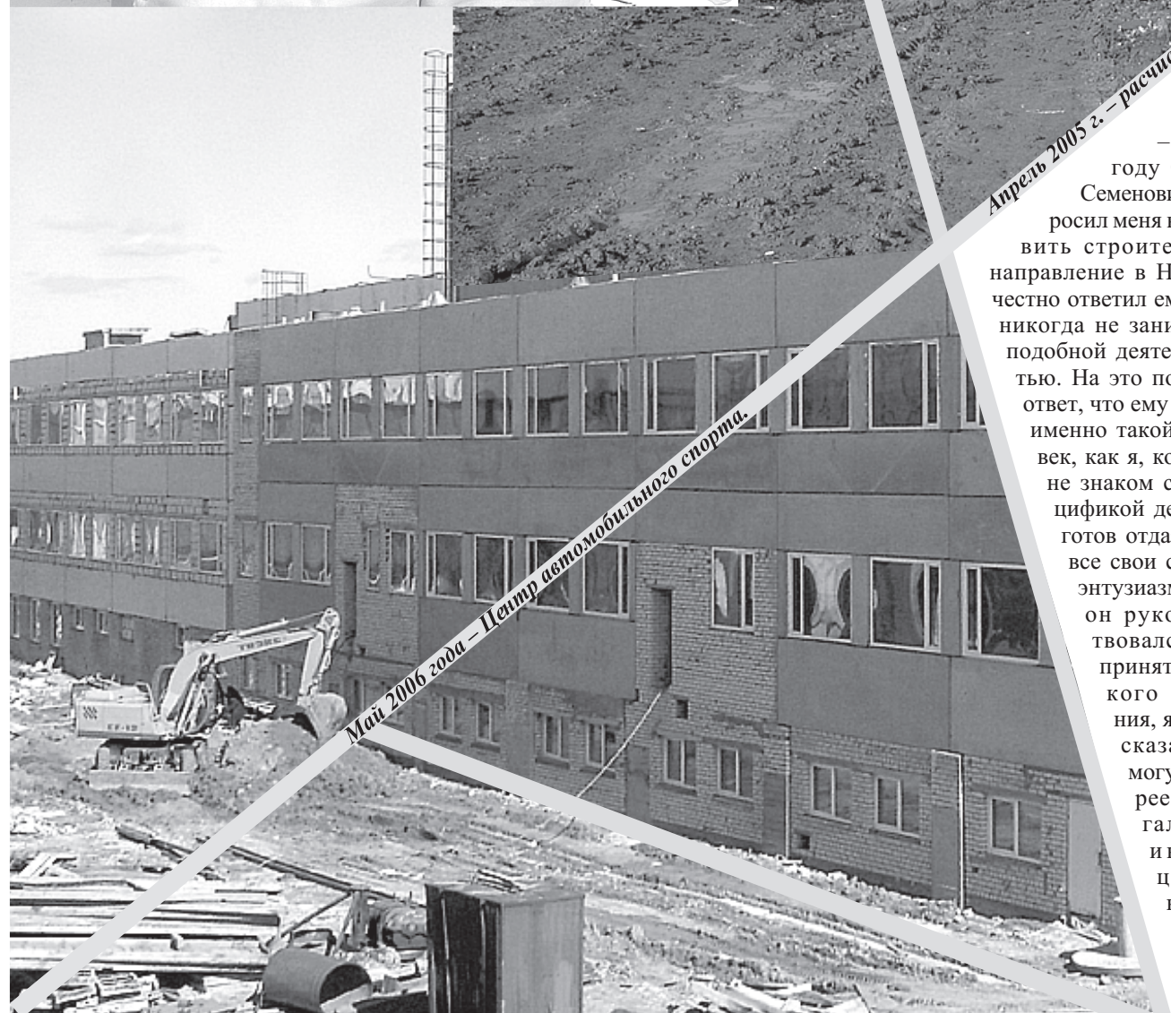
Апрель 2005 г. – расчистка территории.