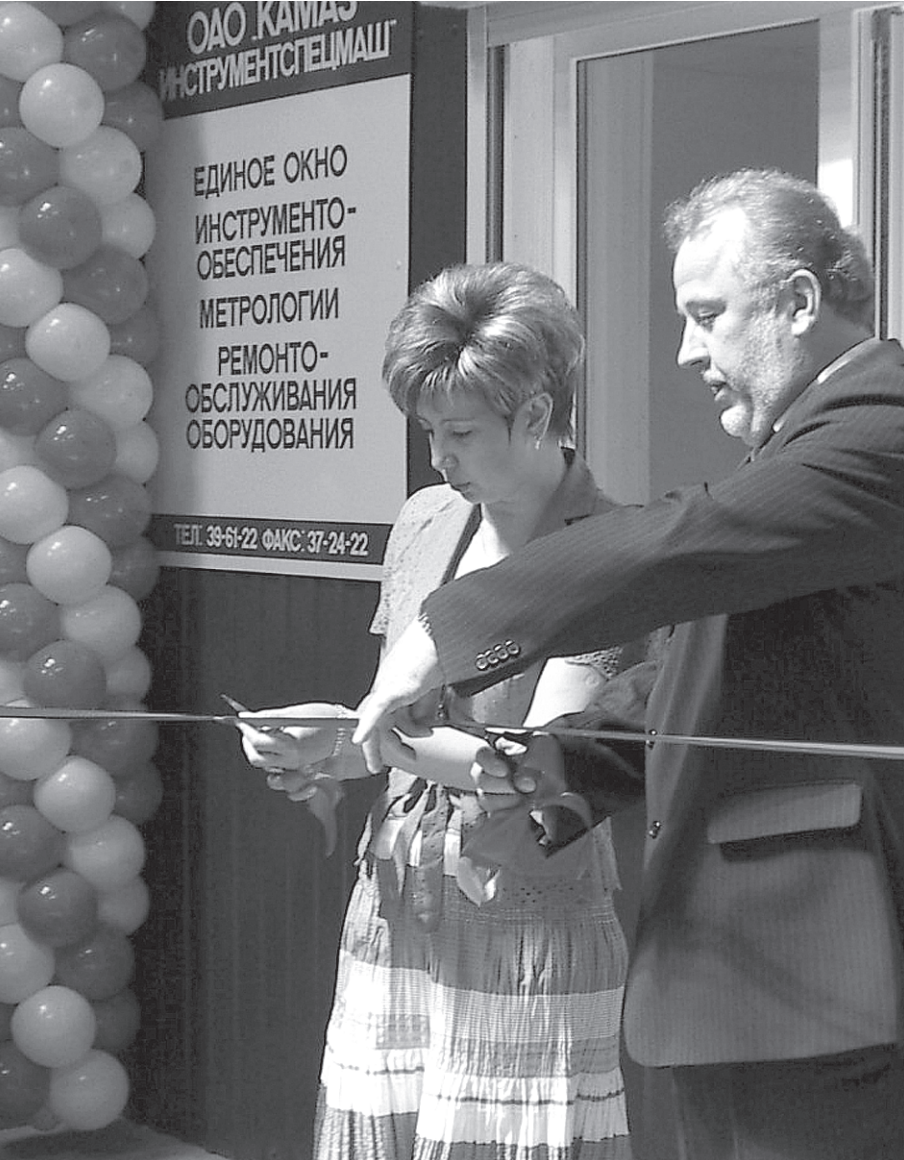
Так торжественно в мае прошлого года было открыто «Единое окно»

очень удобно, с ВОХР выяснение вопросов затягивается, тормозится и документооборот, и ввоз-вывоз товара, что малому бизнесу, предпочитающему (и справедливо!) оперативность нашей родимой тяготине, конечно же, не выгодно;