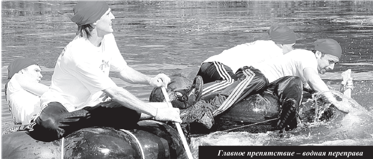
Главное препятствие — водная переправа

— 150 секунд штрафа! — тут же назвал цену ошибки летящий след в след за спортсменами главный вдохновитель