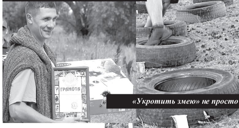
«Укротить змею» не просто

В ТФК ценят не только за профмастерство, но и за «золотой» голос