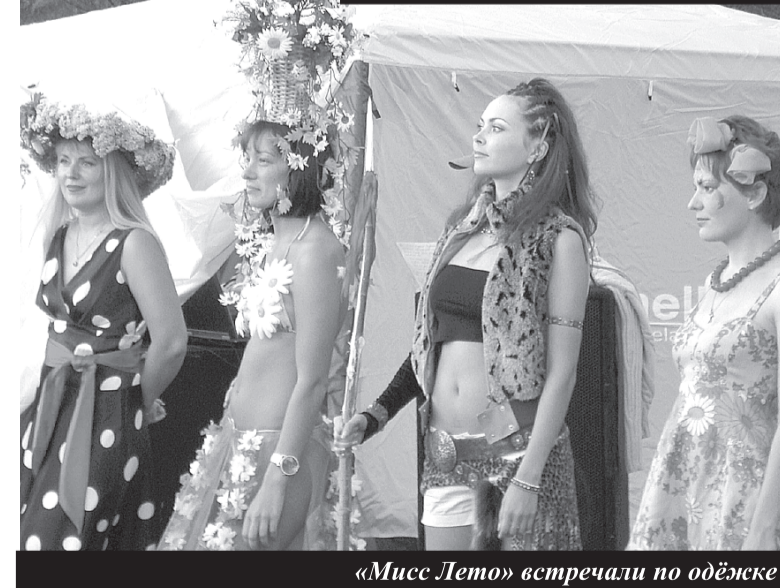
«Мисс Лето» встречали по одежке