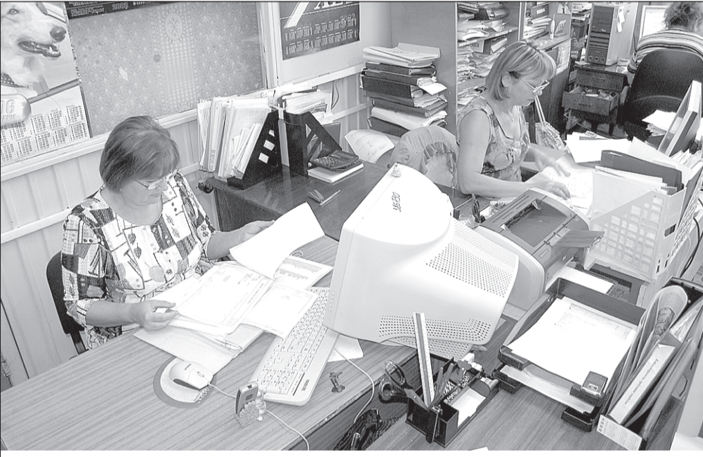
Рабочее место нормировщика. Пока нормативы хранятся на бумажных носителях

Специалисты отдела автоматизированных разработок смотрят дальше. Электронный справочник параметров нормирования – лишь платформа для реализации последующих проектов. В ближайшее время на его основе планируется продолжить работу над автоматизацией процесса нормирования изготовления поковок.