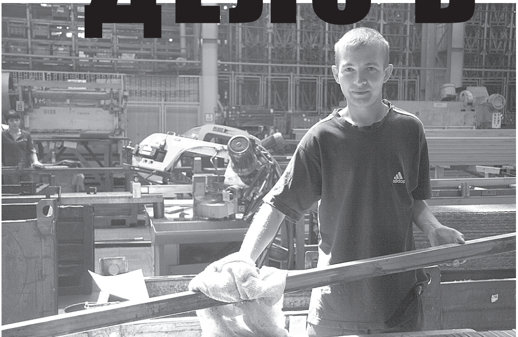
Теперь человека с тряпкой заменяет «ЛИК»