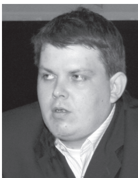
Консультант по работе с общественными организациями заместителя генерального директора по

— Вы — наше будущее, для вас делается все возможное.