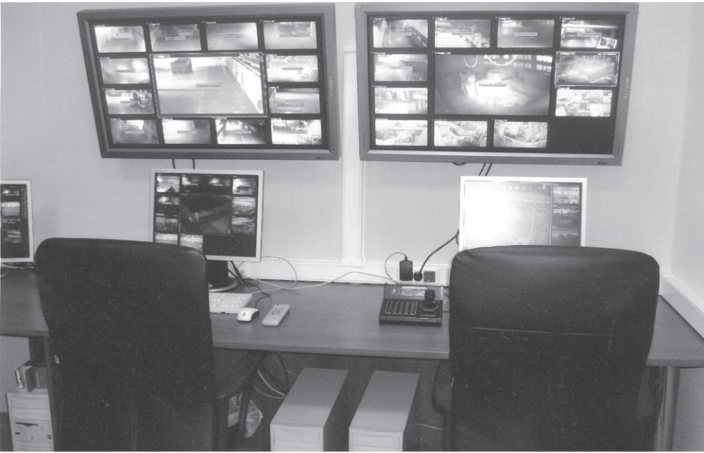
В НТЦ: всё под контролем!

гому пути. В перспективе — замена двух координатных станций. Отдельно надо сказать о нашем партнёрстве с фирмой «Билайн». За два с половиной года «Билайн» в Челнах выполнил все задачи, которые ставил перед ним «КАМАЗ». Улучшена зона покрытия заводов, для чего фирма поставила базовые станции на литейном заводе, в районе завода двигателей, и новый сегмент — на дирекцию. На качество связи будут работать и новые станции — репиторы — в зоне отдыха, в «Дубках» и на «Литейщике». Для справки: каждая стоит 250-300 тысяч долларов, но ведущий оператор мобильной связи готов и далее инвестировать в «КАМАЗ». Один из совместных наших успешных проектов — GSM-шлюз.