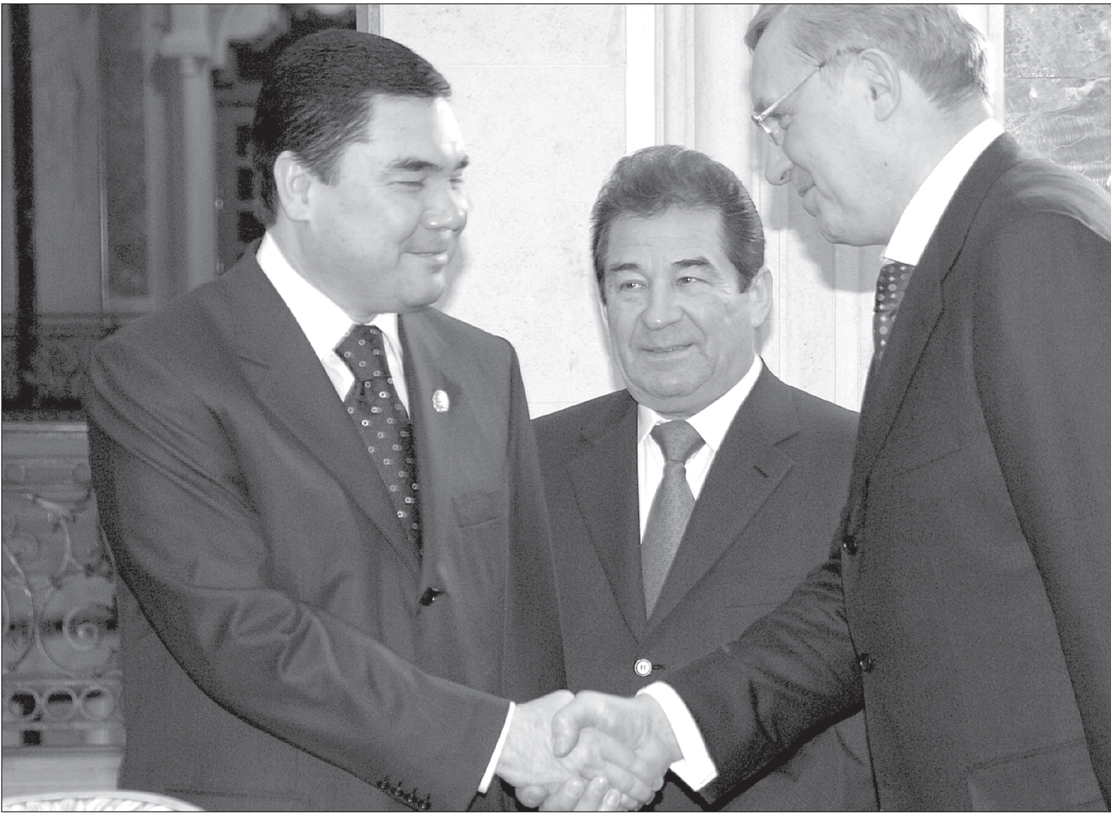
Президент Туркменистана Гурбангулы Бердымухамедов и генеральный директор «КАМАЗа» Сергей Когогин: пожелания первого Президента Туркменистана выполнены

В 2008 ГОДУ В ТУРКМЕНИСТАН БУДЕТ ПОСТАВЛЕНО В 6 РАЗ БОЛЬШЕ АВТОМОБИЛЕЙ КАМАЗ, ЧЕМ В МИНУВШЕМ.