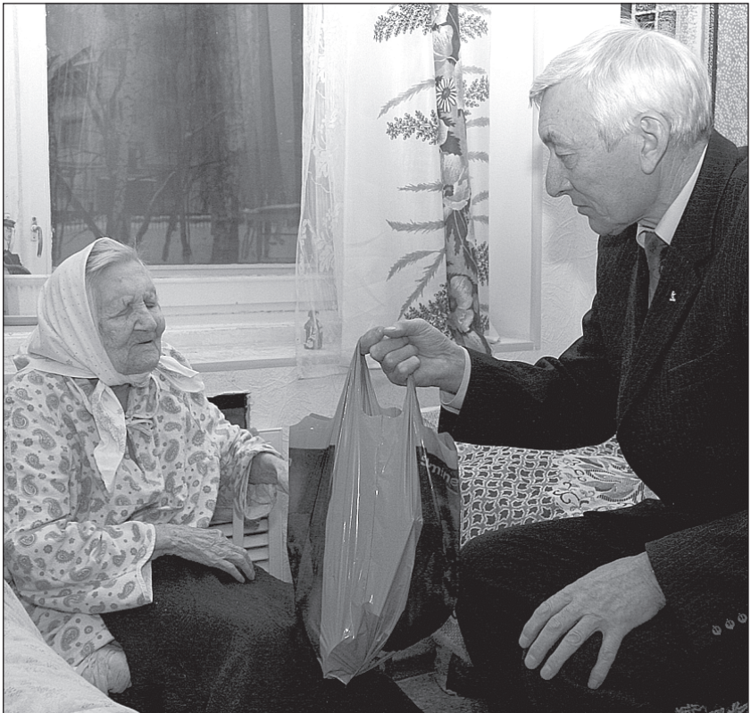
Сладкий подарок от профсоюза

Минтагирович вручил директору и председателю профкома ОАО «КАМАТранссервис» благодарственные письма. А обитатели дома-интерната не хотели прощаться с гостями. – Мы до утра готовы слушать ваши песни, приезжайте к нам на Новый год, – уговаривали они артистов. – Давно мы не видели такого хорошего концерта. Отпустили их лишь после того, как была назначена новая дата встречи – 14 февраля, на День Святого Валентина. О том, что в календаре появился праздник всех влюбленных, они услышали впервые, но дату запомнили.