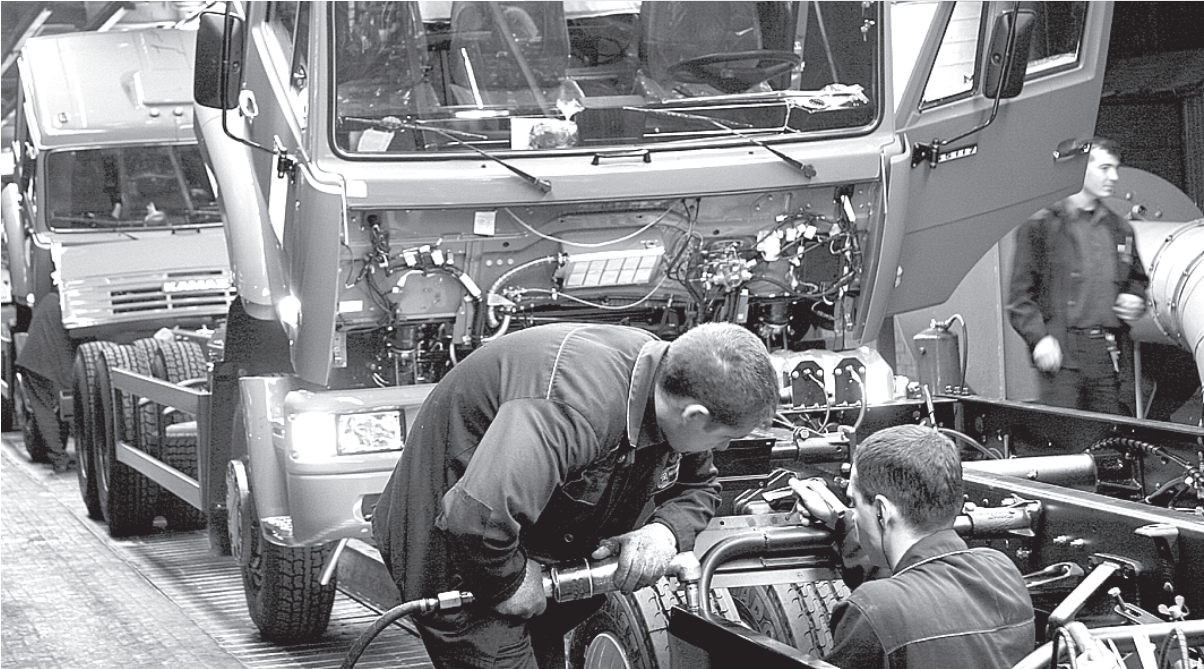
За три дня семинара его участники побывали на заводах «КАМАЗа»