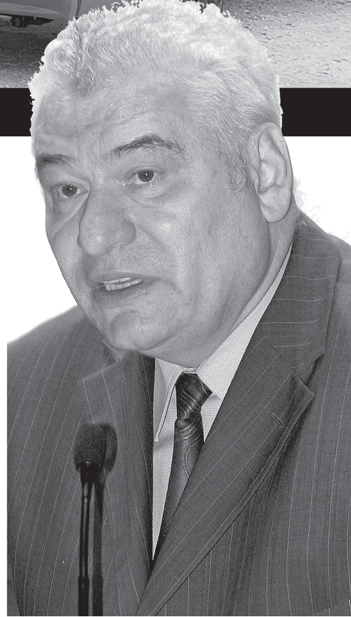
С ролью ведущего директор САМТ-Фонда справился блестяще

Но главный вопрос, который интересовал «КАМАЗ», других представителей автопрома, изготавливающих шасси, и самих делегатов от заводов спецнастроек, – что