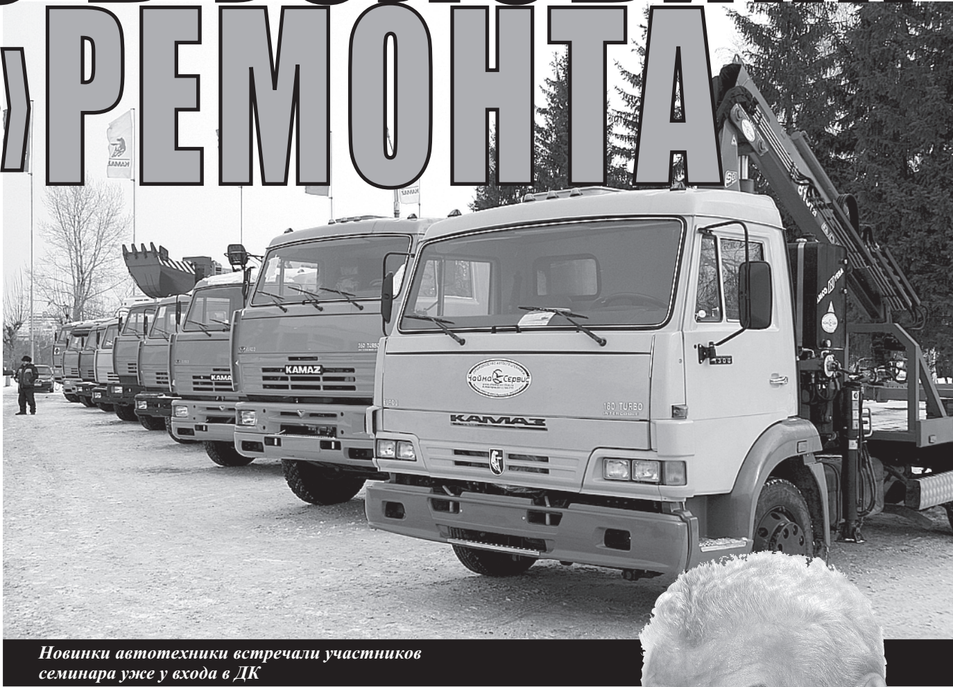
Новинки автотехники встречали участников семинара уже у входа в ДК

ТЕХНИЧЕСКИЙ РЕГЛАМЕНТ – УТВЕРЖДЕННЫЙ КОМПЕТЕНТНЫМ ПРАВИТЕЛЬСТВЕННЫМ ОРГАНОМ ДОКУМЕНТ, В КОТОРОМ УСТАНАВЛИВАЮТСЯ ОБЯЗАТЕЛЬНЫЕ ДЛЯ СОБЛЮЖДЕНИЯ ХАРАКТЕРИСТИКИ ТОВАРА ИЛИ СВЯЗАННЫЕ С НИМ ПРОЦЕССЫ И МЕТОДЫ ПРОИЗВОДСТВА.