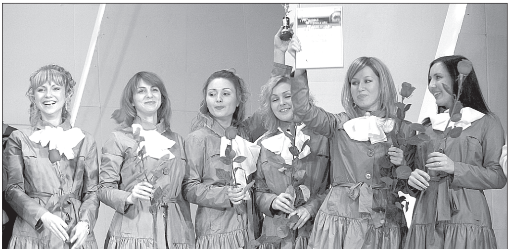
Победительницы в номинации «Лучший командный результат» представляли «КАМАЗ» на Московском автосалоне-2006

В числе победителей звучал темпераментный курай и, конечно же, песня о «КАМАЗе» в исполнении детей студии «Дебют».