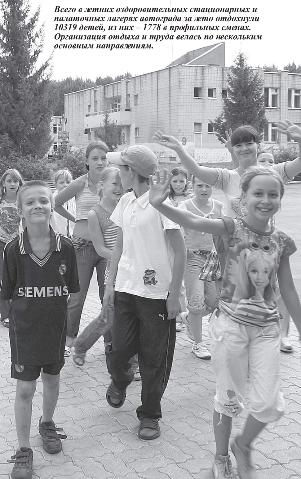
Всего в летних оздоровительных стационарных и палаточных лагерях автограда за лето отдохнули 10319 детей, из них – 1778 в профильных сменах. Организация отдыха и труда велась по нескольким основным направлениям.