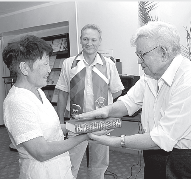
Подарок межзаводской библиотеке «КАМАЗа» от автора

Здесь осталось только положить второй слой асфальта и установить бордюры. На остановке «Студенческая», где расположен один из самых проблемных перекрестков, есть зебра и предупреждающие дорожные знаки. Однако водители часто их игнорируют и не уступают дорогу пешеходам. Эта проблема в скором времени разрешится. На новом перекрестке появятся светофоры. Планируется установить 20 пешеходных и 14 транспортных светофоров. На эти цели выделено 700 тысяч рублей. Светофоры установят на следующей неделе.