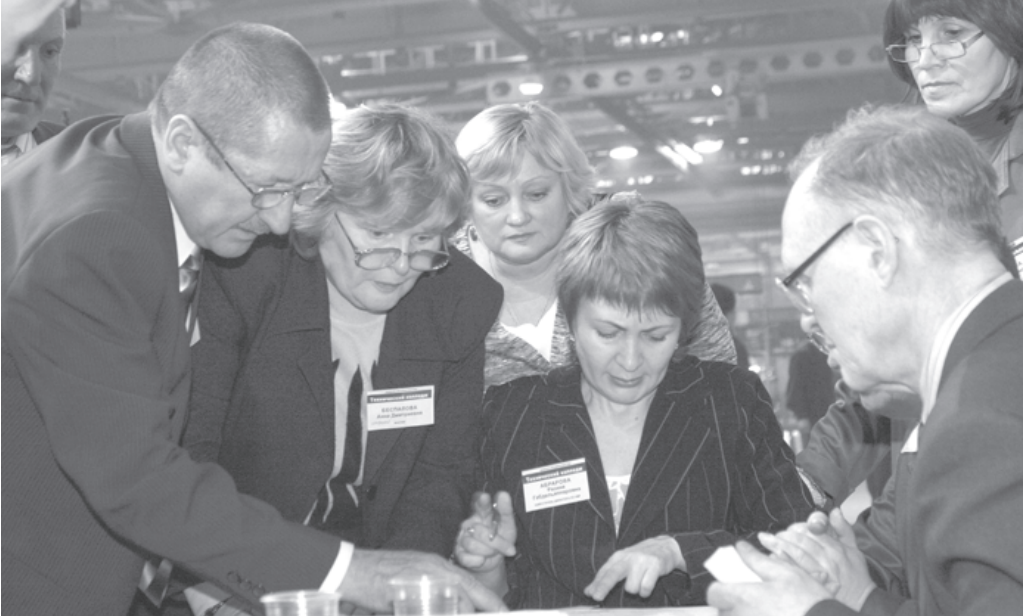
Трудное это дело — быть членом жюри