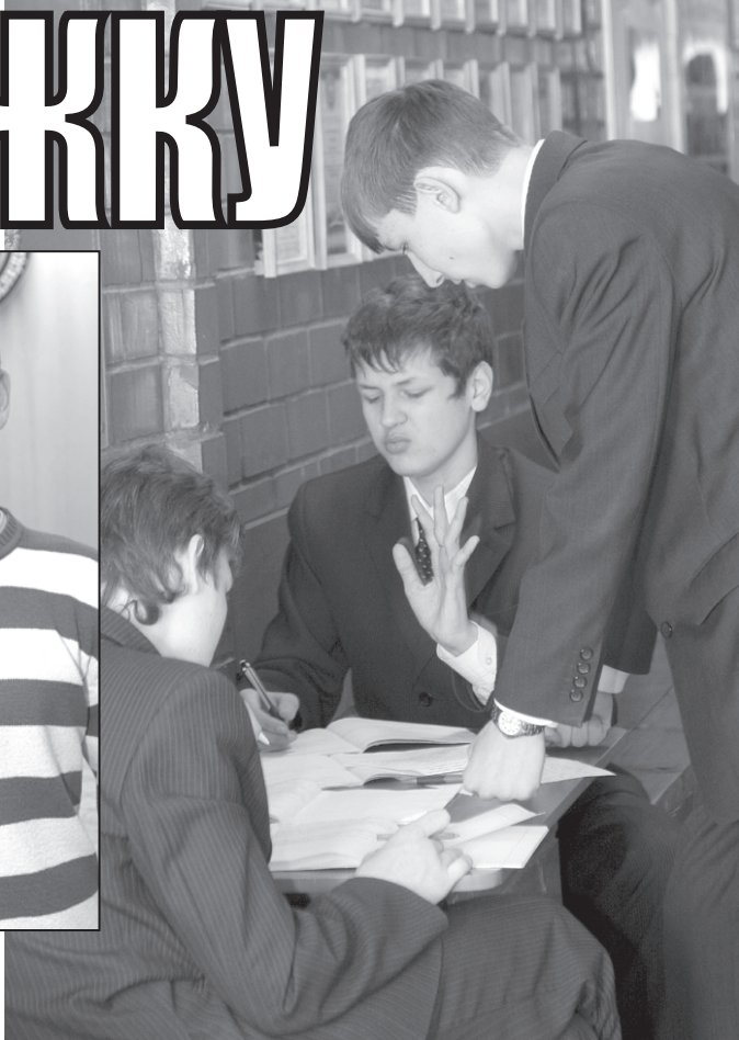
Теория? Нет проблем!